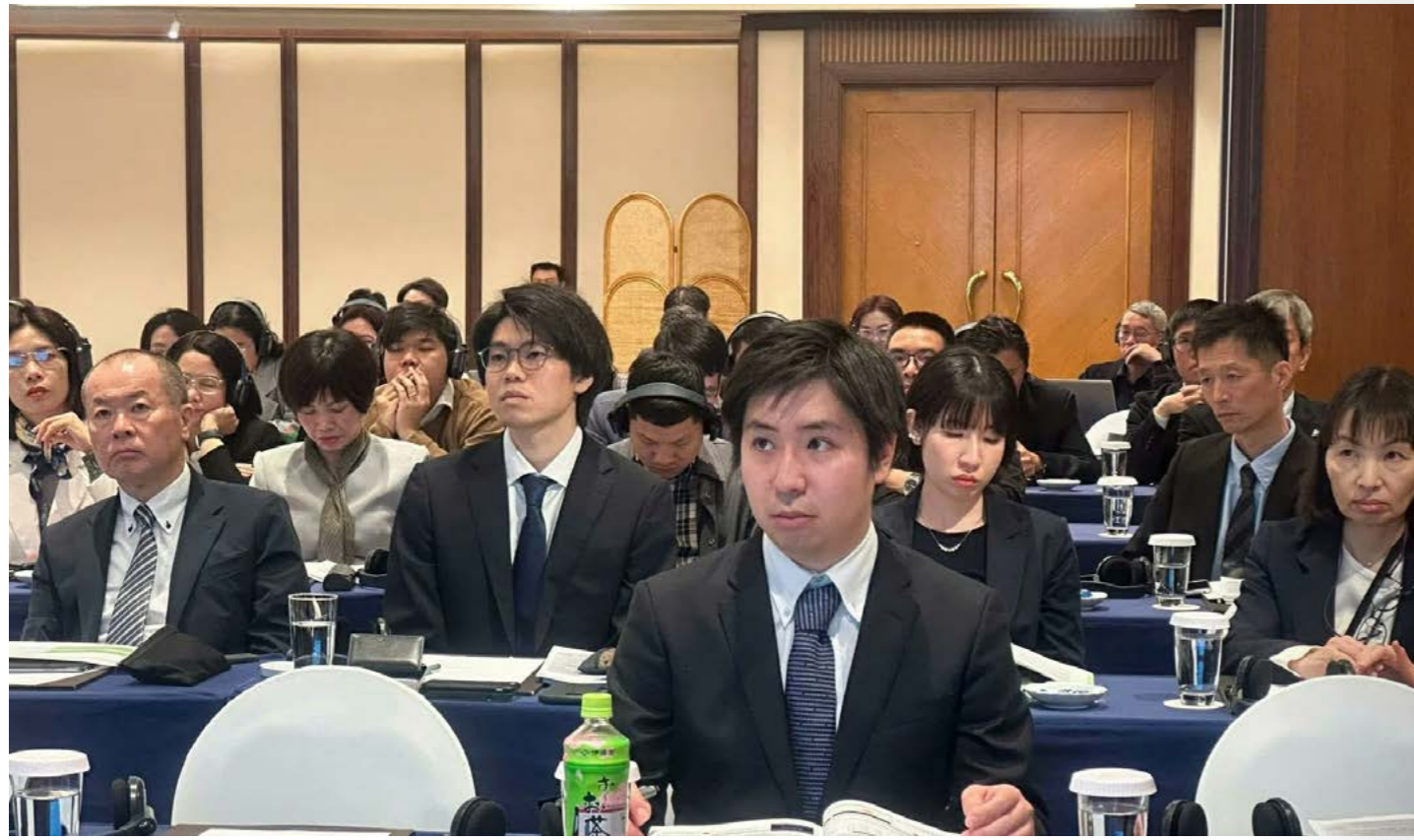
Các đại biểu của Nhật Bản tham dự hội thảo.

Ngày 3/2/2026, tại Hà Nội, Hiệp hội Bảo hiểm Phi nhân thọ Nhật Bản (GIAJ), Viện Bảo hiểm Phi nhân thọ Nhật Bản (GIJ), và Hiệp hội Bảo hiểm Việt Nam (IAV) phối hợp tổ chức Hội thảo hải Ngoại ISJ với chủ đề: “Vai trò và thách thức của ngành bảo hiểm phi nhân thọ trong kỷ nguyên phát triển bền vững”.