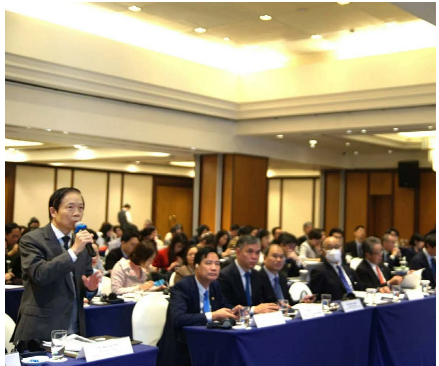
Các đại biểu của Nhật Bản tham dự hội thảo.

Bên cạnh đó, Hiệp hội bảo hiểm Phi nhân thọ Nhật Bản và Viện Bảo hiểm Phi nhân thọ Nhật Bản còn phối hợp với Hiệp hội bảo hiểm Việt Nam tổ chức nhiều chương trình hội thảo hải ngoại (Oversea Seminar) tại Việt Nam (được tài trợ bởi Hiệp hội bảo hiểm Phi nhân thọ Nhật Bản) về các lĩnh vực trong bảo hiểm phi nhân thọ. Những kết quả đạt được đã góp phần khẳng định mối quan hệ hợp tác tin cậy, hiệu quả và ngày càng gắn bó giữa hai Hiệp hội.