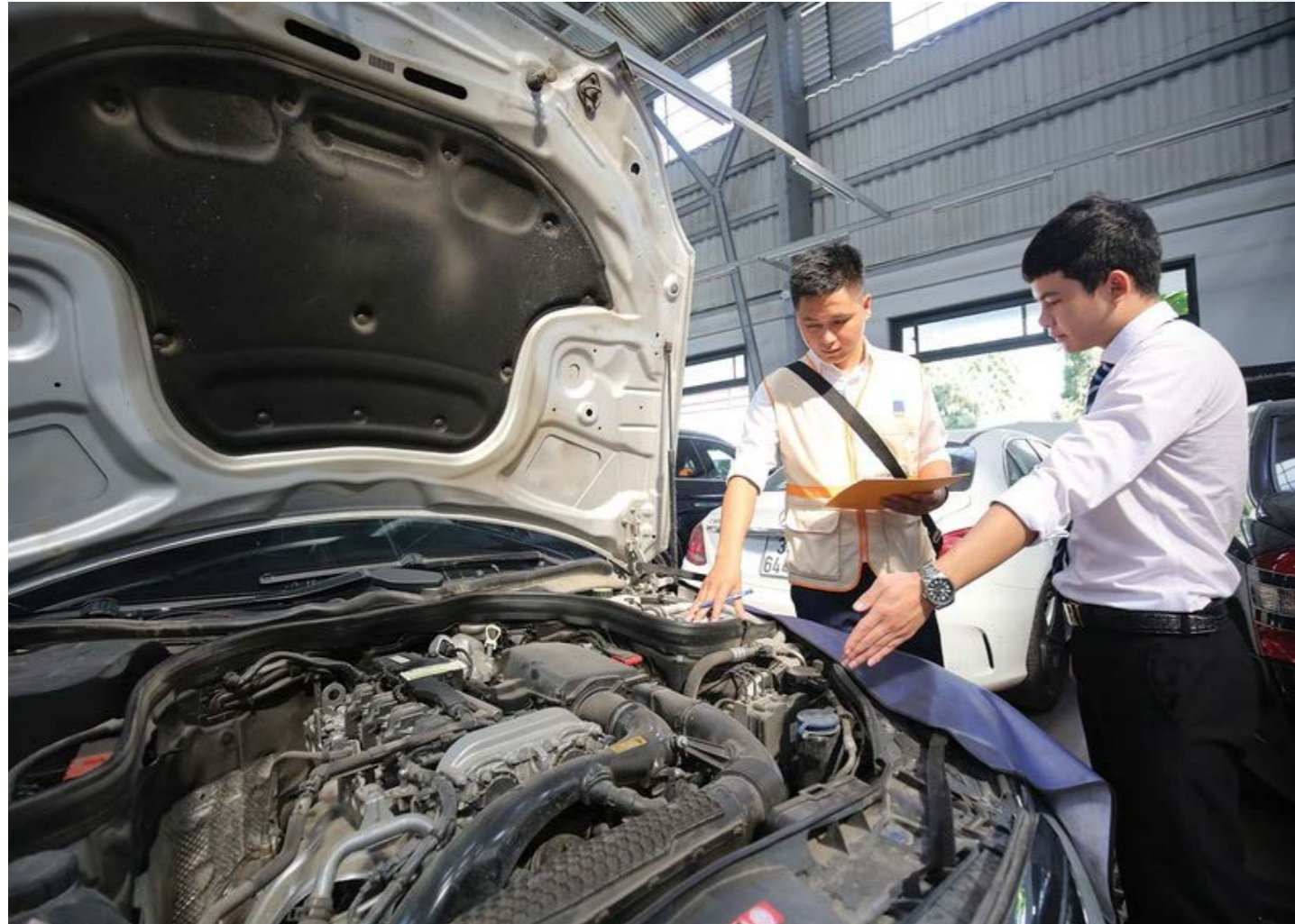
Kết quả cao năm 2025 vừa là nền tảng, vừa là sức ép cho các doanh nghiệp bảo hiểm phi nhân thọ trong năm 2026

(ĐTCK) Các doanh nghiệp bảo hiểm phi nhân thọ đã bắt đầu triển khai kế hoạch kinh doanh cho năm tài chính 2026 với những mục tiêu đầy tham vọng.