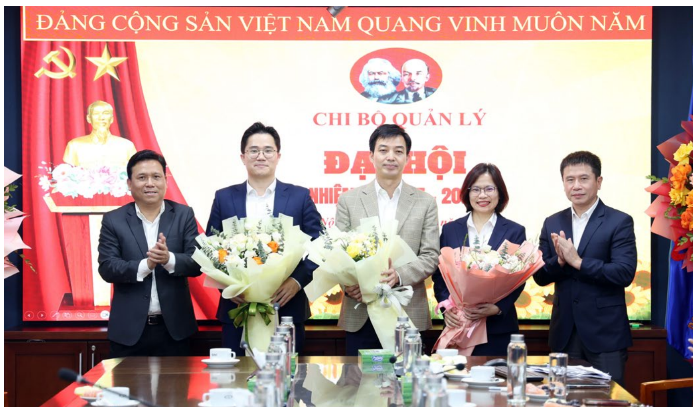
Chi ủy Chi bộ Quản lý nhiệm kỳ 2025-2027 ra mắt Đại hội