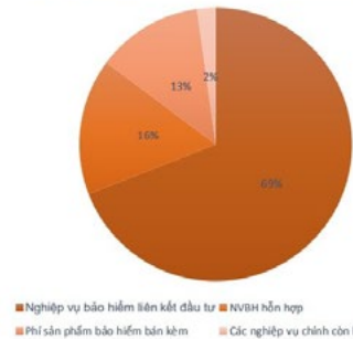
Cơ cấu doanh thu phí bảo hiểm nhân thọ