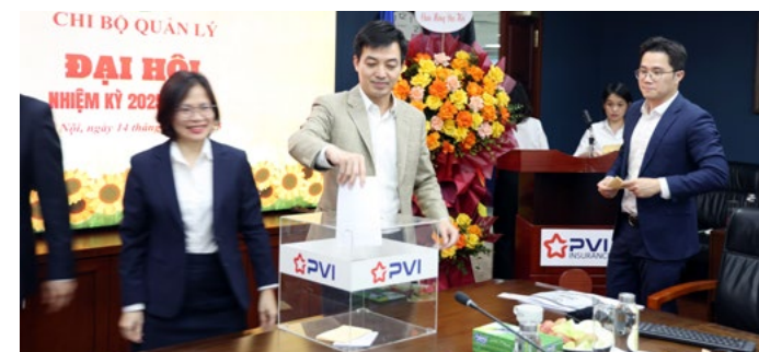
Các Đại biểu bỏ phiếu bầu các chức danh Chi ủy Chi bộ Quản lý

quyết tâm của toàn thể Đảng viên trong việc thực hiện các nhiệm vụ chiến lược, góp phần đưa Bảo hiểm PVI ngày càng vững mạnh, phát triển bền vững và đạt được các mục tiêu quan trọng trong thời gian tới.