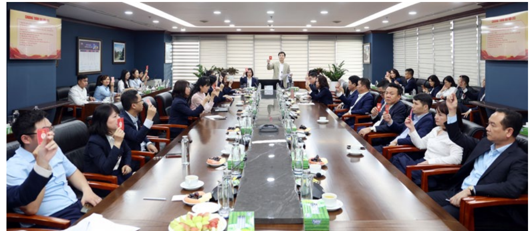
Các Đại biểu biểu quyết thông qua các chương trình Hội nghị