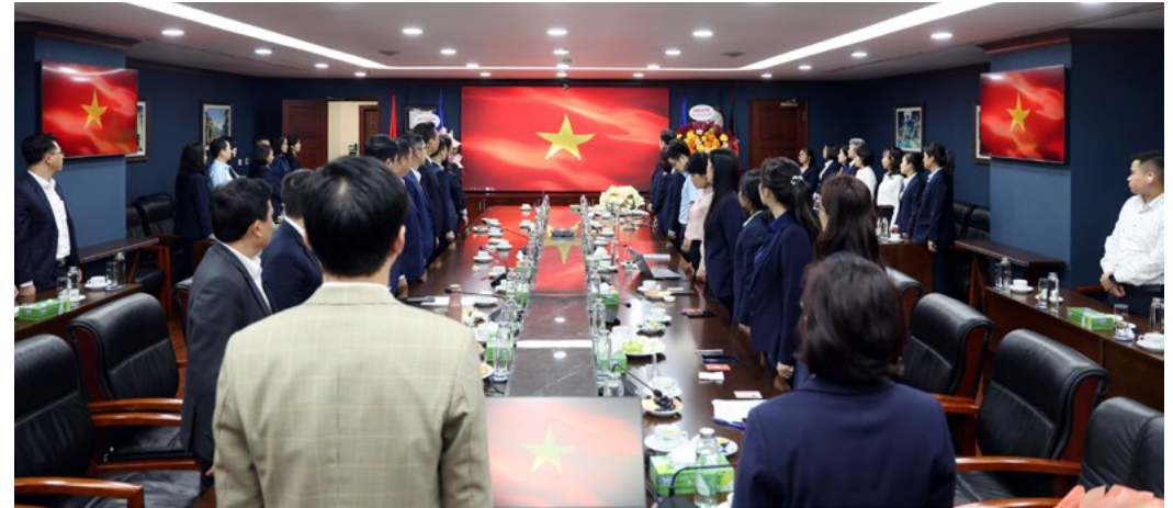
Các Đại biểu là nghi lễ chào cờ

Đặc biệt, trong phần phát biểu, các đại biểu cũng nhấn mạnh công tác bồi thường của Bảo hiểm PVI sau bão Yagi đã được khách hàng ghi nhận và đánh giá cao. Đây là minh chứng rõ nét cho năng lực xử lý bồi thường nhanh chóng, chuyên nghiệp của Bảo hiểm PVI, củng cố niềm tin của khách hàng và khẳng định vị thế hàng đầu trên thị trường bảo hiểm Việt Nam.