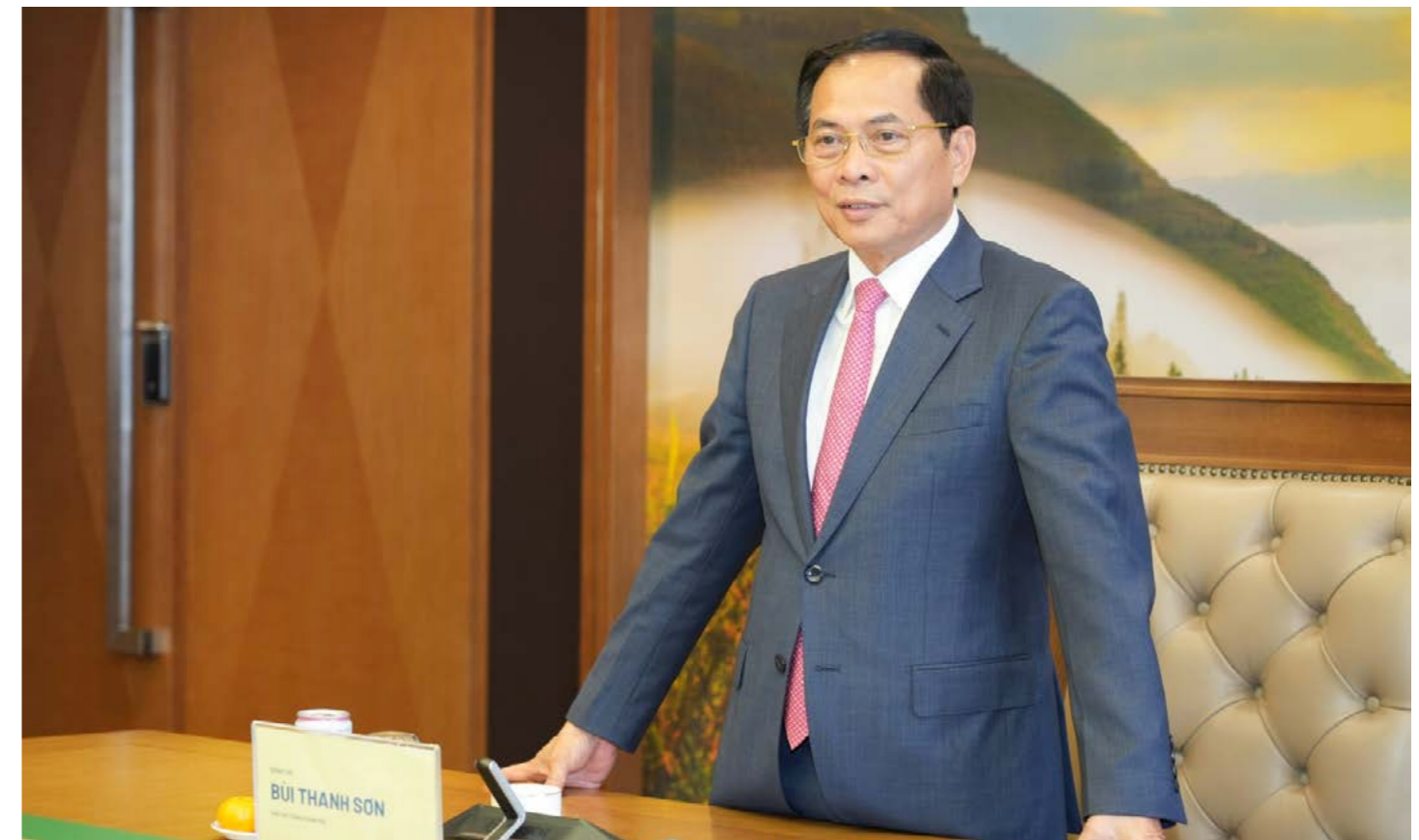
Phó Thủ tướng Bùi Thanh Sơn kỳ vọng Tập đoàn phấn đấu đạt mức tăng trưởng trên 10%, tiếp tục giữ vai trò đầu tàu trong bảo đảm an ninh năng lượng và ổn định kinh tế vĩ mô.