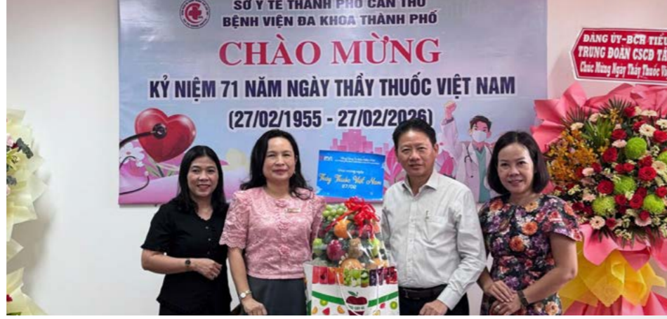
Đại diện Bảo hiểm PVI đến thăm và chúc mừng Bệnh viện Đa khoa Thành phố Cần Thơ

175 và Bảo hiểm PVI sẽ tiếp tục tối ưu hóa quy trình bảo lãnh viện phí, giúp người bệnh tiếp cận dịch vụ y tế kỹ thuật cao một cách nhanh chóng và thuận tiện nhất. Bệnh viện Quân y 175 cam kết sẽ không ngừng cải thiện chất lượng chuyên môn và dịch vụ để luôn là địa chỉ tin cậy, đồng hành cùng Bảo hiểm PVI trong sứ mệnh chăm sóc và bảo vệ sức khỏe cộng đồng. Hy vọng trong năm 2026, hai bên sẽ có thêm nhiều dự án đột phá, nâng tầm mối quan hệ đối tác chiến lược này.”