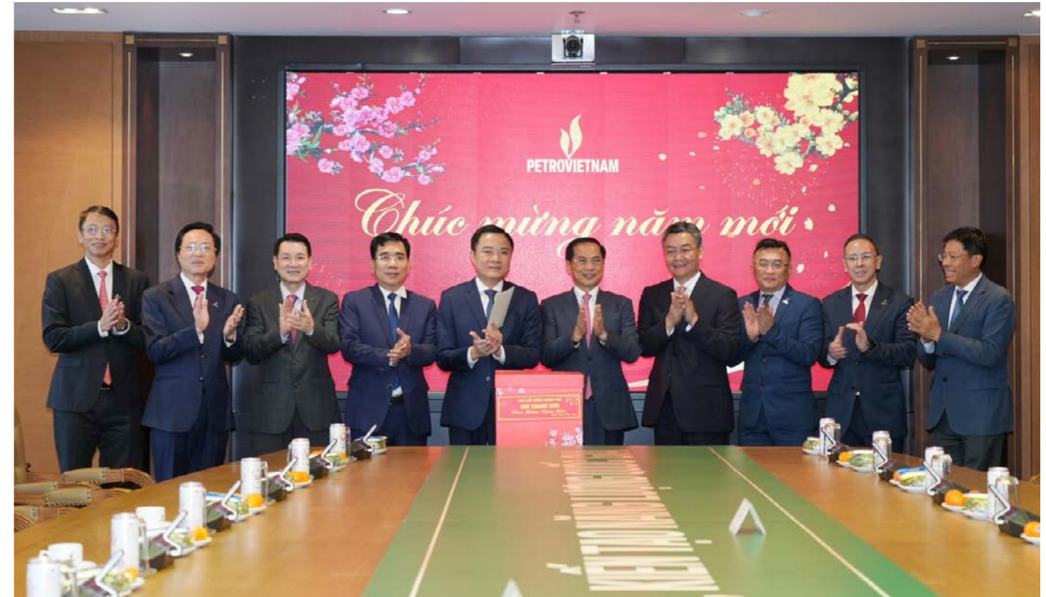
Phó Thủ tướng Bùi Thanh Sơn trao quà, gửi lời chúc Tết tới tập thể lãnh đạo và người lao động Petrovietnam nhân dịp đầu Xuân năm mới

Chủ tịch HĐQT Petrovietnam khẳng định, trên tinh thần đoàn kết “Một đội ngũ - Một mục tiêu”, Tập đoàn cam kết phấn đấu hoàn thành toàn diện các chỉ tiêu đề ra, tiếp tục khẳng định vị thế là tập đoàn hàng đầu của nền kinh tế đất nước.