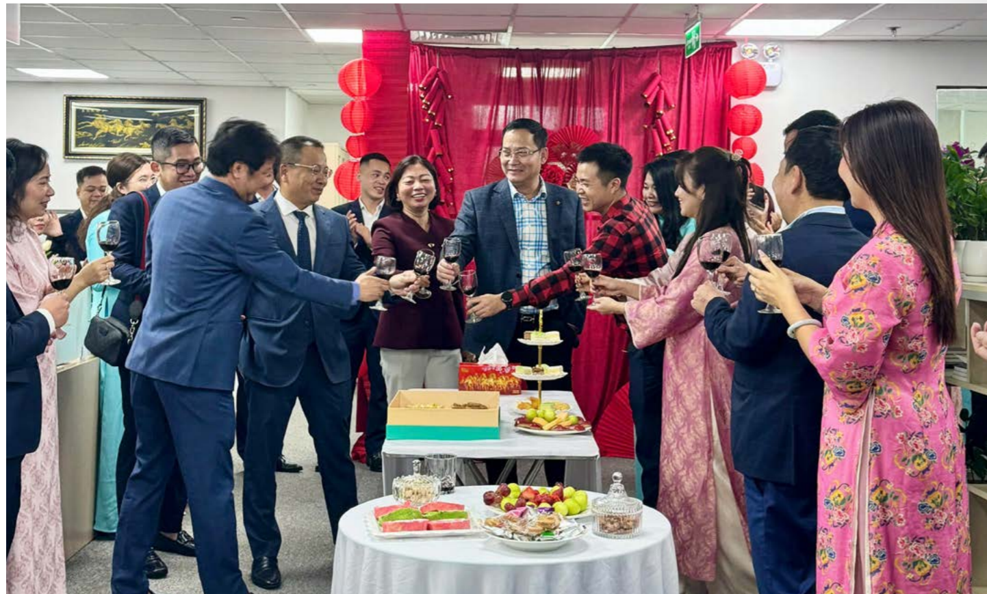
Ban Lãnh đạo Bảo hiểm PVI chúc mừng khai xuân tại Bảo hiểm PVI Thăng Long