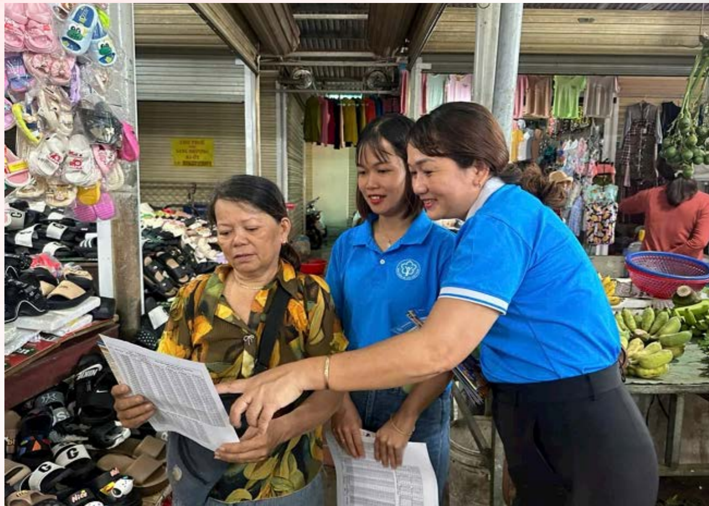
Tuyên truyền chính sách bảo hiểm xã hội, bảo hiểm y tế tới tiểu thương tại Bắc Ninh.

(TBTCO) - Bộ Nội vụ vừa có Quyết định số 176/QĐ-BNV về việc ban hành Kế hoạch tuyên truyền bảo hiểm xã hội giai đoạn 2026 - 2030, hướng tới mục tiêu bảo hiểm xã hội toàn dân.