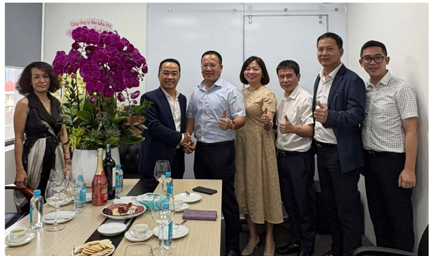
Ban Lãnh đạo Bảo hiểm PVI chúc mừng khai xuân tại Bảo hiểm PVI Nam Sài Gòn