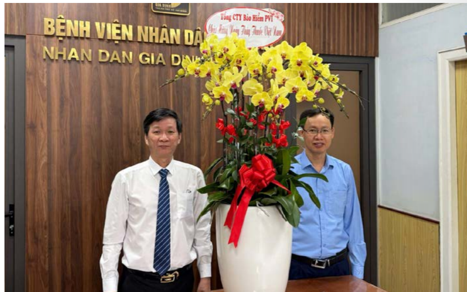
Đại diện Bảo hiểm PVI đến thăm và chúc mừng Bệnh viện Nhân dân Gia Định

Hoạt động tri ân nhân Ngày Thầy thuốc Việt Nam không chỉ thể hiện sự gắn kết bền chặt giữa Bảo hiểm PVI và hệ thống cơ sở y tế đối tác, mà còn khẳng định cam kết đồng hành lâu dài của doanh nghiệp trong việc nâng cao chất lượng dịch vụ bảo hiểm sức khỏe, tối ưu hóa quyền lợi và trải nghiệm cho khách hàng. Với niềm tin vào tinh thần trách nhiệm, y đức và sự tận tâm của đội ngũ thầy thuốc, Bảo hiểm PVI tin tưởng ngành y tế Việt Nam sẽ tiếp tục phát triển mạnh mẽ, đóng góp tích cực vào sự nghiệp chăm sóc, bảo vệ và nâng cao sức khỏe cộng đồng trong giai đoạn mới.