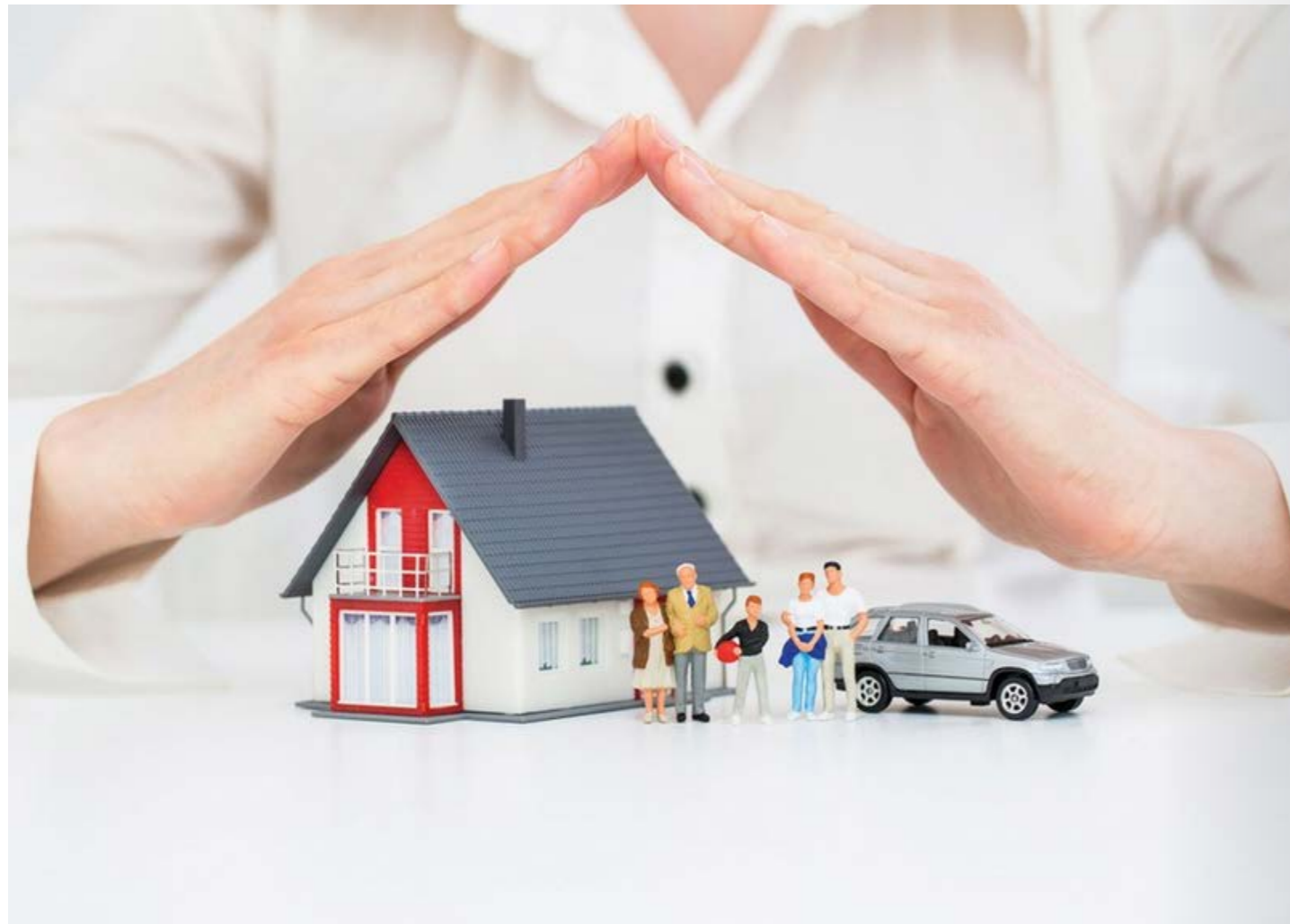
Thị trường bảo hiểm Việt Nam đã cho thấy sự hồi phục tích cực khi tất cả các chỉ tiêu đều đã lấy lại tăng trưởng dương.

(TBTCO) - Thị trường bảo hiểm Việt Nam đã cho thấy sự hồi phục tích cực khi tất cả các chỉ tiêu đều đã lấy lại tăng trưởng dương, tiếp tục khẳng định là kênh dẫn vốn trung, dài hạn quan trọng. Trong bối cảnh đó, việc tạo lập môi trường pháp lý thuận lợi, minh bạch, tạo điều kiện thuận lợi cho doanh nghiệp trở thành yếu tố mang tính quyết định, không chỉ giúp doanh nghiệp vượt khó, mà còn mở ra dư địa phát triển bền vững cho thị trường.