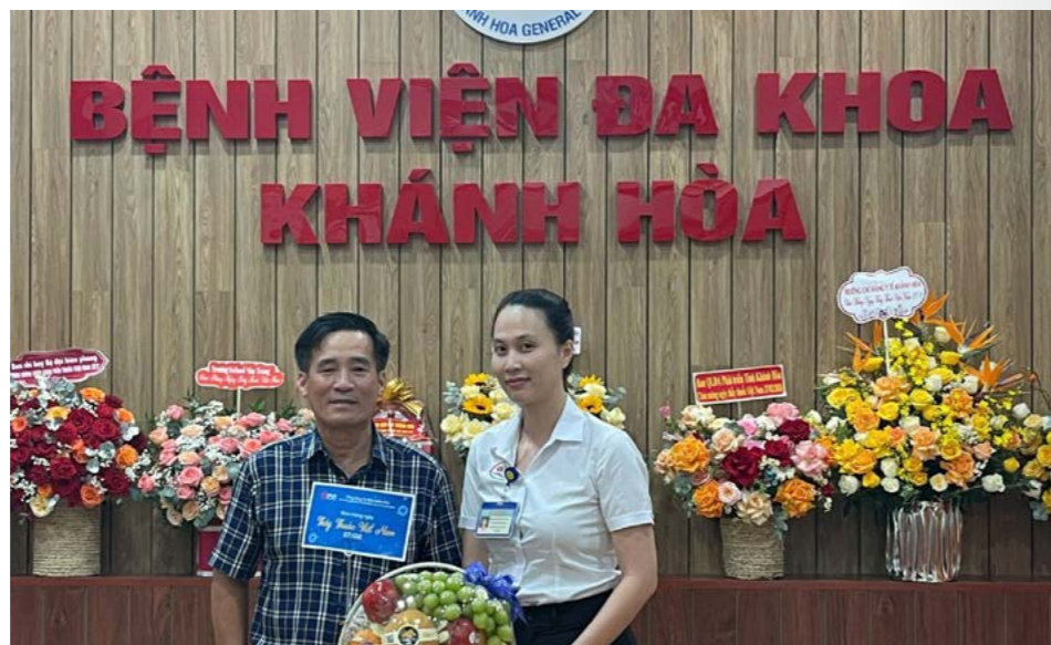
Đại diện Bảo hiểm PVI đến thăm và chúc mừng Bệnh viện Đa khoa Khánh Hòa