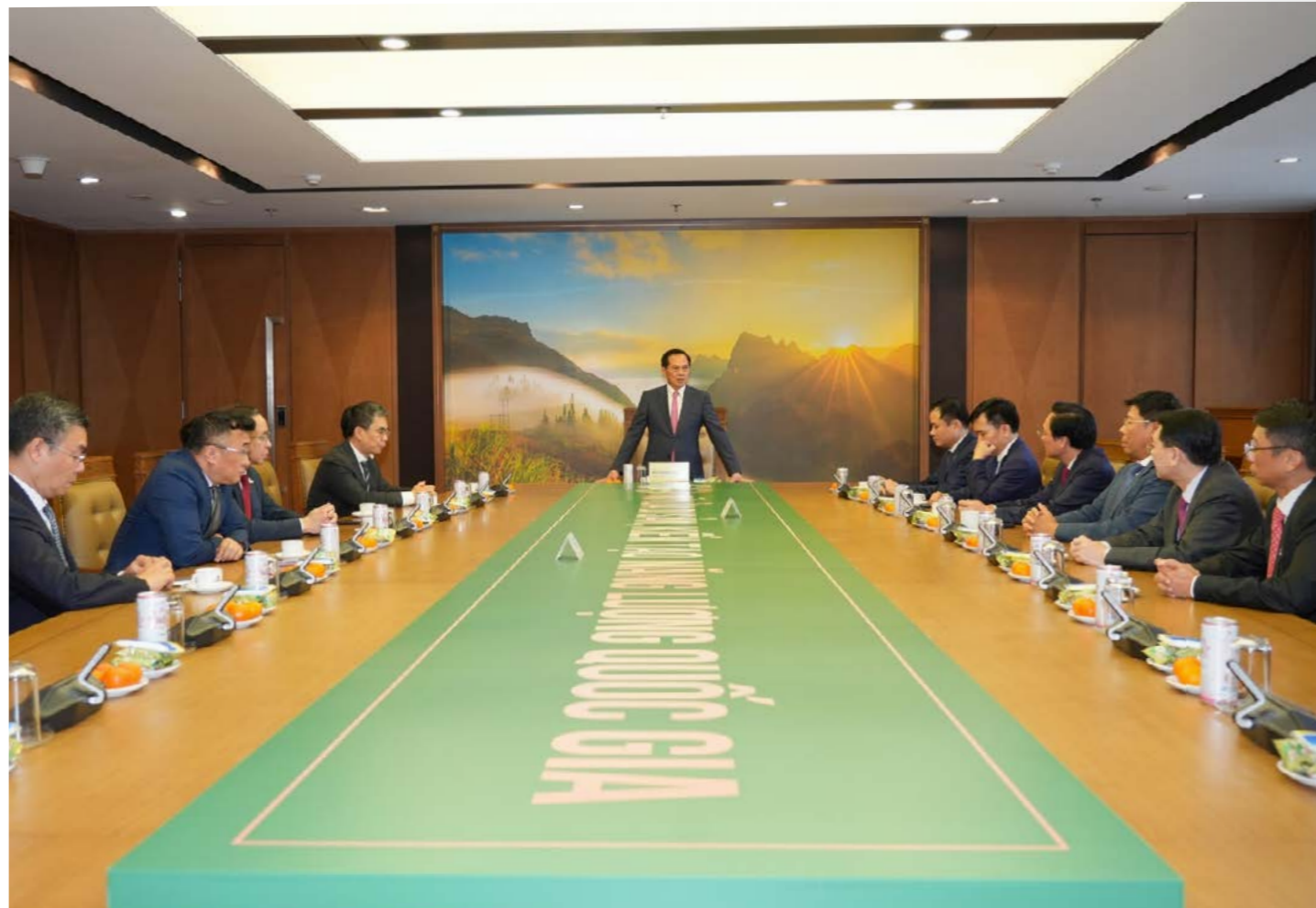
Phó Thủ tướng Bùi Thanh Sơn thăm, chúc Tết, động viên tập thể lãnh đạo, cán bộ, người lao động Petrovietnam

Ngay ngày làm việc đầu tiên sau kỳ nghỉ Tết Nguyên đán Bính Ngọ 2026, ngày 23/2 (mùng 7 Tết), Phó Thủ tướng Chính phủ Bùi Thanh Sơn đã đến thăm, chúc Tết và động viên tập thể lãnh đạo, cán bộ, người lao động Tập đoàn Công nghiệp - Năng lượng Quốc gia Việt Nam (Petrovietnam), đồng thời bày tỏ kỳ vọng Tập đoàn tiếp tục phát huy vai trò trụ cột, đóng góp quan trọng vào mục tiêu tăng trưởng hai con số của đất nước trong giai đoạn phát triển mới.