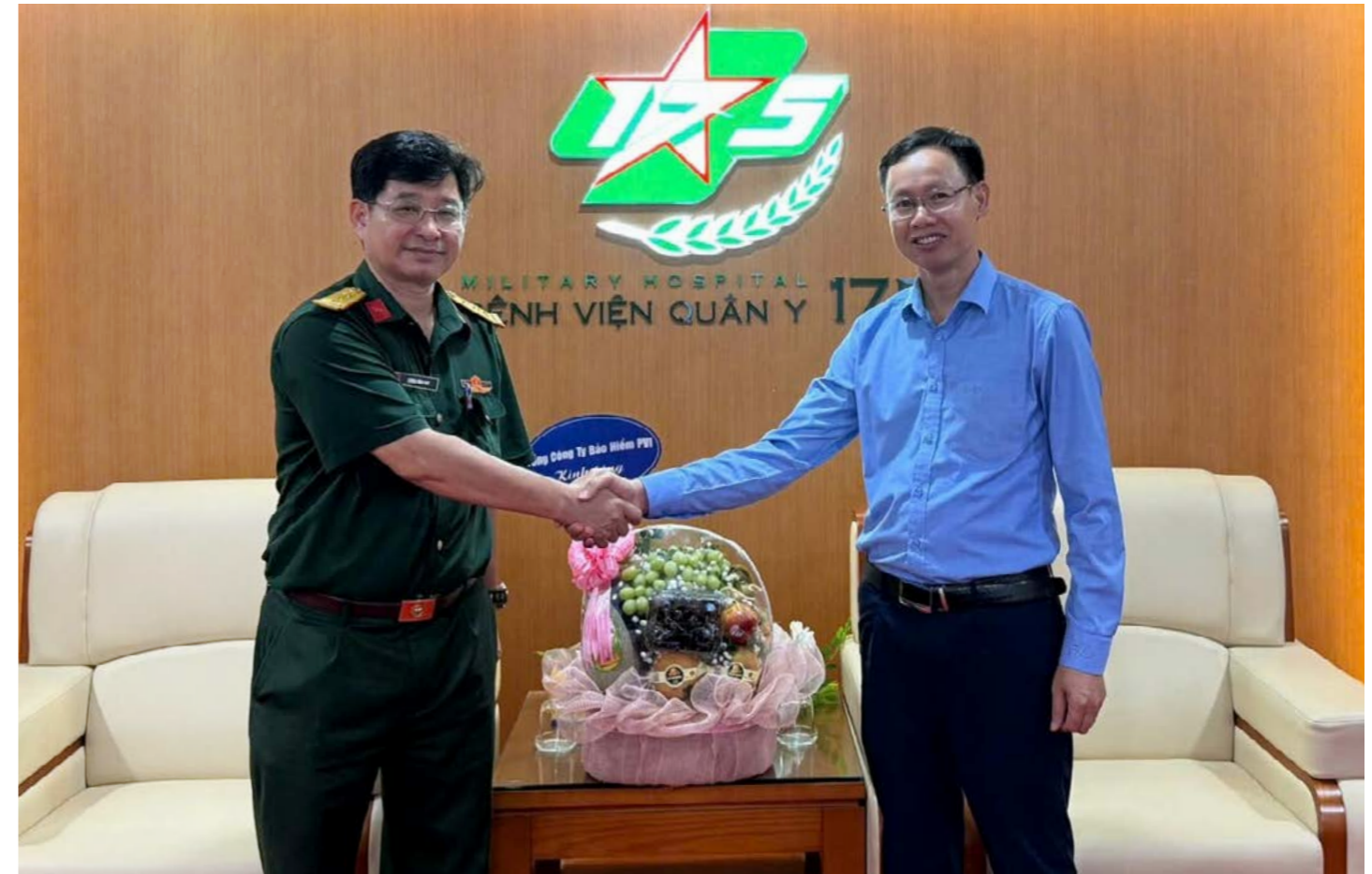
Đại diện Bảo hiểm PVI đến thăm và chúc mừng Bệnh viện Quân Y 175

Nhân dịp kỷ niệm 71 năm Ngày Thầy thuốc Việt Nam (27/02/1955 – 27/02/2026), đại diện Tổng Công ty Bảo hiểm PVI cùng các đơn vị thành viên khu vực phía Nam đã tổ chức nhiều đoàn công tác đến thăm, chúc mừng và tri ân đội ngũ y bác sĩ tại các cơ sở y tế đối tác.