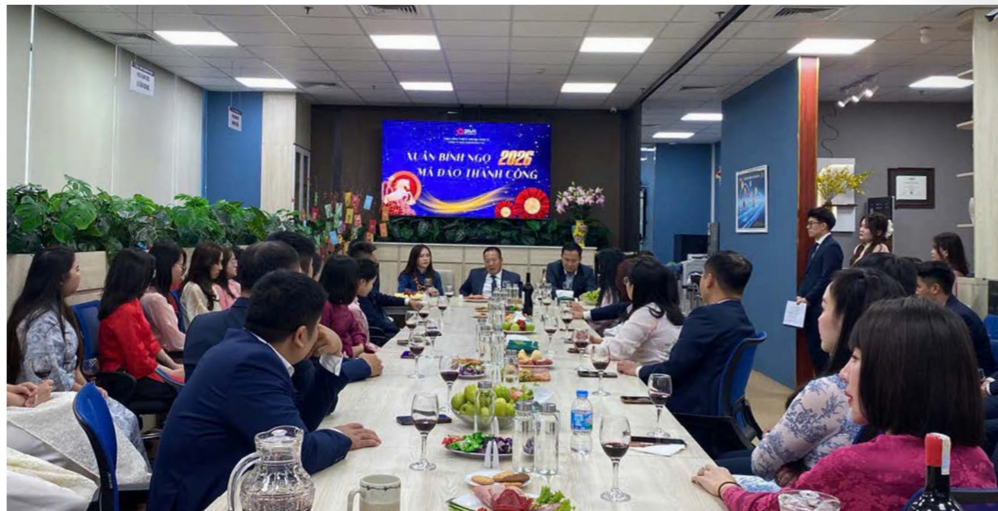
Ban Lãnh đạo Bảo hiểm PVI chúc mừng khai xuân tại Bảo hiểm PVI Âu Lạc

Nhân dịp đầu xuân năm mới, Ban Lãnh đạo Tổng Công ty Bảo hiểm PVI đã đến thăm và chúc mừng khai xuân tại các đơn vị thành viên trên cả nước, gửi lời chúc năm mới tới toàn thể cán bộ nhân viên, đồng thời động viên, cổ vũ tinh thần làm việc ngay từ những ngày đầu năm 2026.