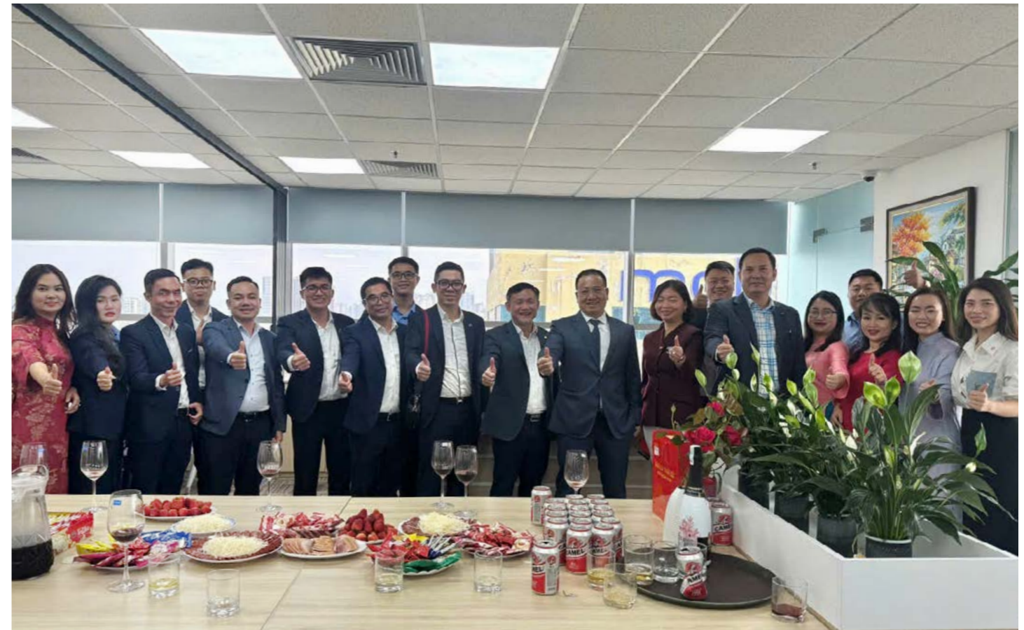
Ban Lãnh đạo Bảo hiểm PVI chúc mừng khai xuân tại Bảo hiểm PVI Link

Những chuyến thăm đầu xuân không chỉ mang ý nghĩa động viên tinh thần mà còn tiếp thêm năng lượng tích cực, tạo khí thế thi đua sôi nổi ngay từ những ngày làm việc đầu tiên. Với nền tảng vững chắc và tinh thần quyết tâm cao, năm 2026 được kỳ vọng sẽ là một năm bứt phá mạnh mẽ của toàn hệ thống Bảo hiểm PVI.