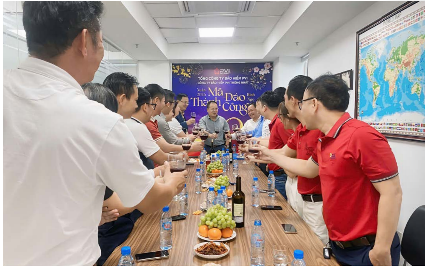
Ban Lãnh đạo Bảo hiểm PVI chúc mừng khai xuân tại Bảo hiểm PVI Thống Nhất