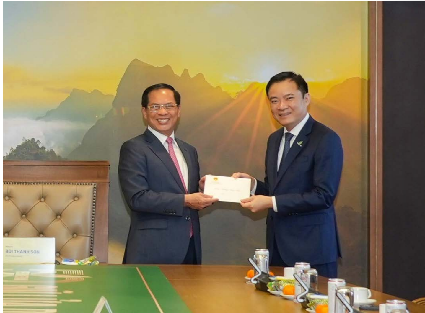
Phó Thủ tướng Bùi Thanh Sơn: Petrovietnam giữ vai trò trụ cột tăng trưởng trong giai đoạn mới

của năm 2025, Tập đoàn đặt mục tiêu trong năm 2026 với những kế hoạch chiến lược hiệu quả, xác định phải tiếp tục duy trì đà tăng trưởng bền vững.