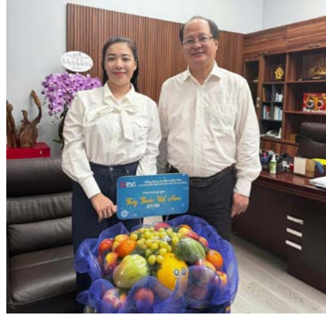
Đại diện Bảo hiểm PVI đến thăm và chúc mừng Bệnh viện Mắt TP.HCM