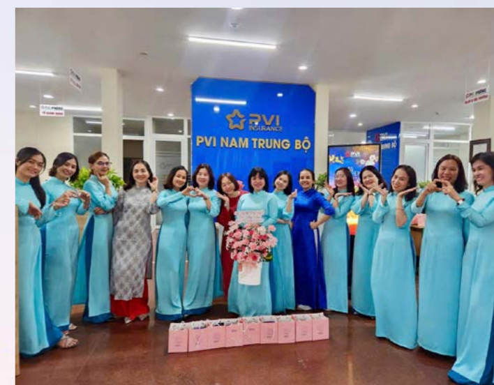
PVI Nam Trung Bộ chúc mừng Ngày Quốc tế Phụ nữ 8/3