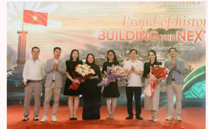
HanoiRe chúc mừng Ngày Quốc tế Phụ nữ 8/3