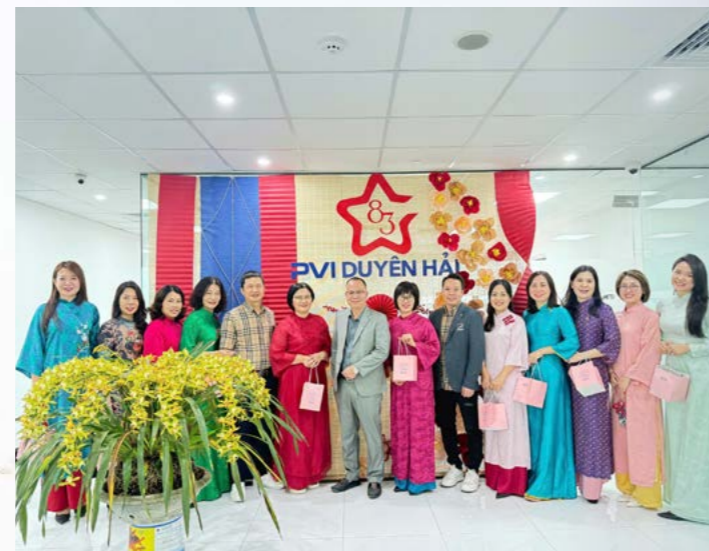
PVI Duyên Hải chúc mừng Ngày Quốc tế Phụ nữ 8/3