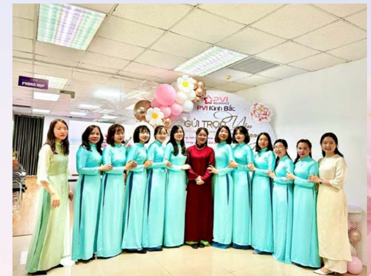
PVI Kinh Bắc chúc mừng Ngày Quốc tế Phụ nữ 8/3