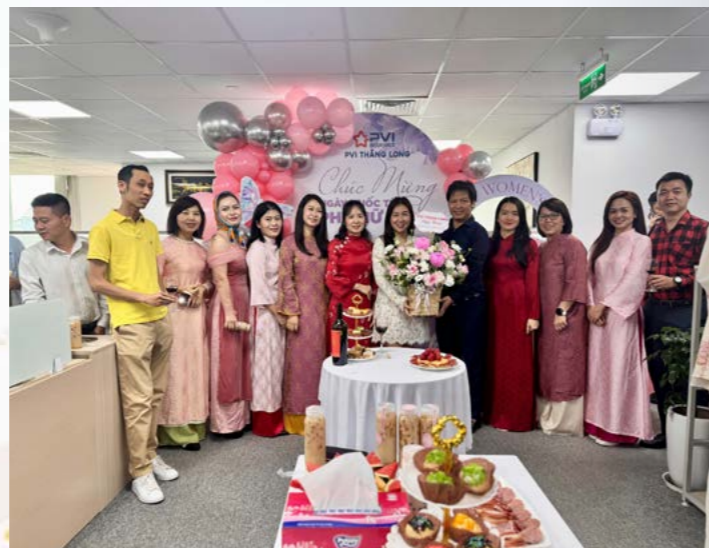
PVI Thăng Long chúc mừng Ngày Quốc tế Phụ nữ 8/3