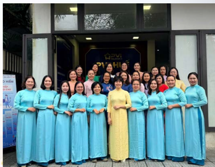
PVI Huế chúc mừng Ngày Quốc tế Phụ nữ 8/3