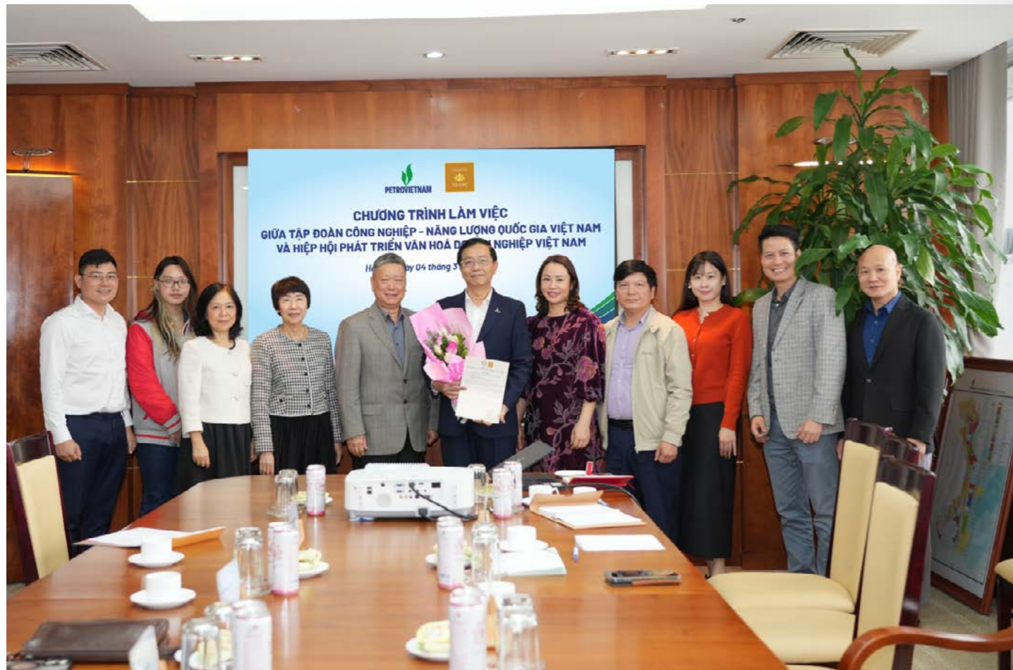
Các đại biểu tham dự buổi làm việc

Nghị quyết số 79-NQ/TW về phát triển kinh tế nhà nước và Nghị quyết số 80-NQ/TW về phát triển văn hóa Việt Nam đều nhấn mạnh yêu cầu gắn tăng trưởng kinh tế với xây dựng chuẩn mực văn hóa, đạo đức và trách nhiệm xã hội trong hoạt động của doanh nghiệp. Trong bối cảnh đó, việc xây dựng và lan tỏa hệ giá trị văn hóa doanh nghiệp không chỉ là yêu cầu nội tại của doanh nghiệp mà còn góp phần khẳng định uy tín và vị thế quốc gia trong giai đoạn phát triển mới.