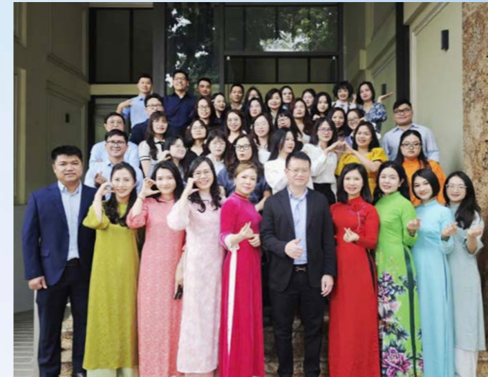
PVI Đông Đô chúc mừng Ngày Quốc tế Phụ nữ 8/3