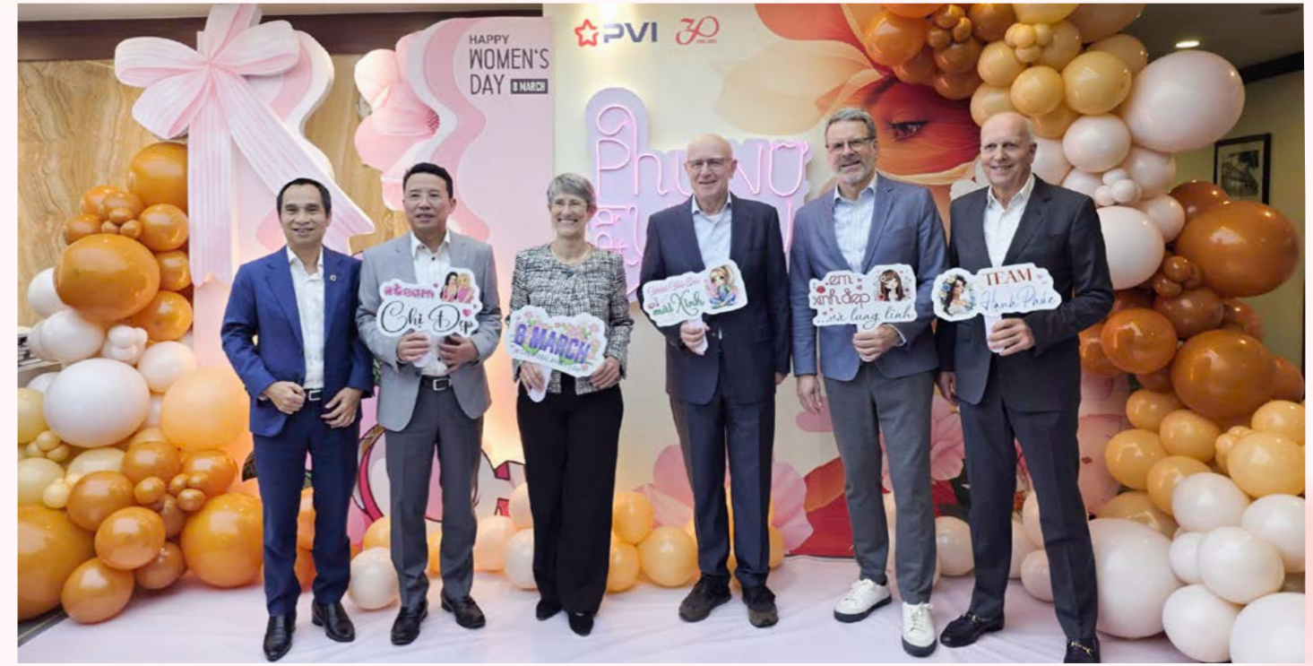
Hội đồng quản trị chúc mừng Ngày Quốc tế Phụ nữ 8/3

Với tinh thần đoàn kết và sự đóng góp của mỗi cá nhân, trong đó có vai trò quan trọng của đội ngũ nữ cán bộ nhân viên, toàn hệ thống PVI tin tưởng sẽ tiếp tục tạo nên những dấu ấn mới trên hành trình phát triển bền vững.