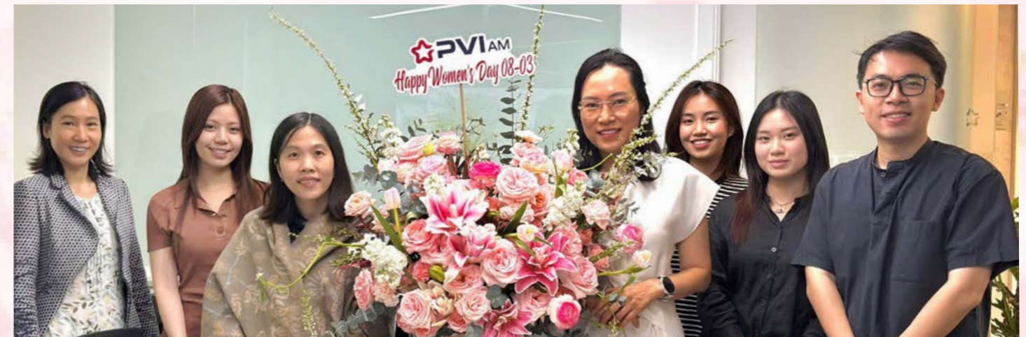
PVI AM chúc mừng Ngày Quốc tế Phụ nữ 8/3