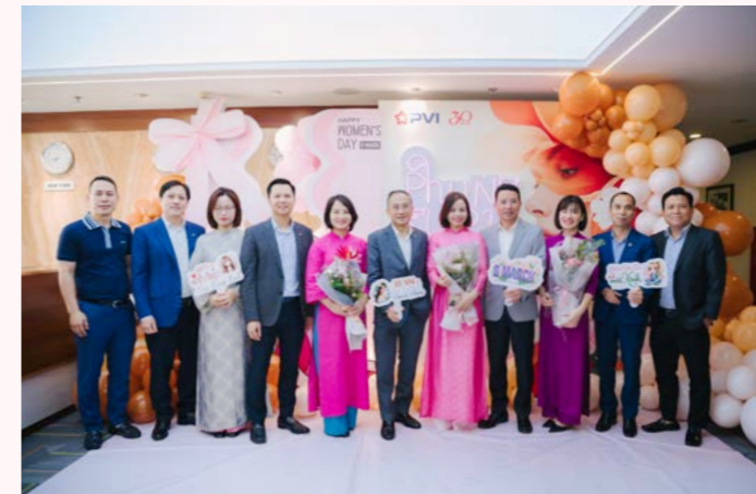
PVI Holdings chúc mừng Ngày Quốc tế Phụ nữ 8/3