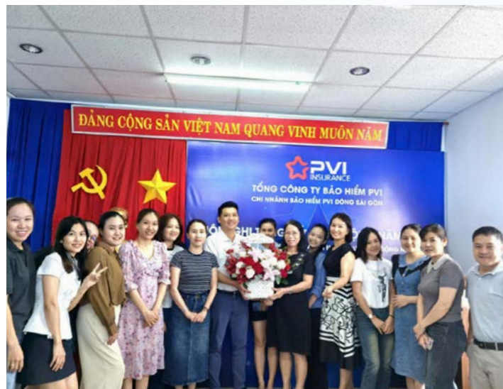
PVI Đông Sài Gòn chúc mừng Ngày Quốc tế Phụ nữ 8/3