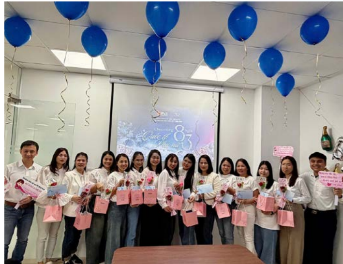
PVI Ninh Bình chúc mừng Ngày Quốc tế Phụ nữ 8/3