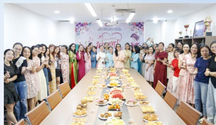
PVI Gia Định chúc mừng Ngày Quốc tế Phụ nữ 8/3