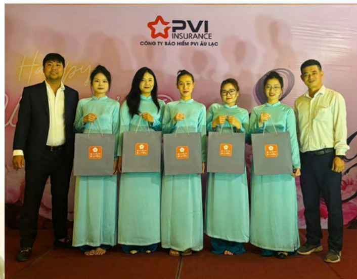
PVI Âu Lạc chúc mừng Ngày Quốc tế Phụ nữ 8/3