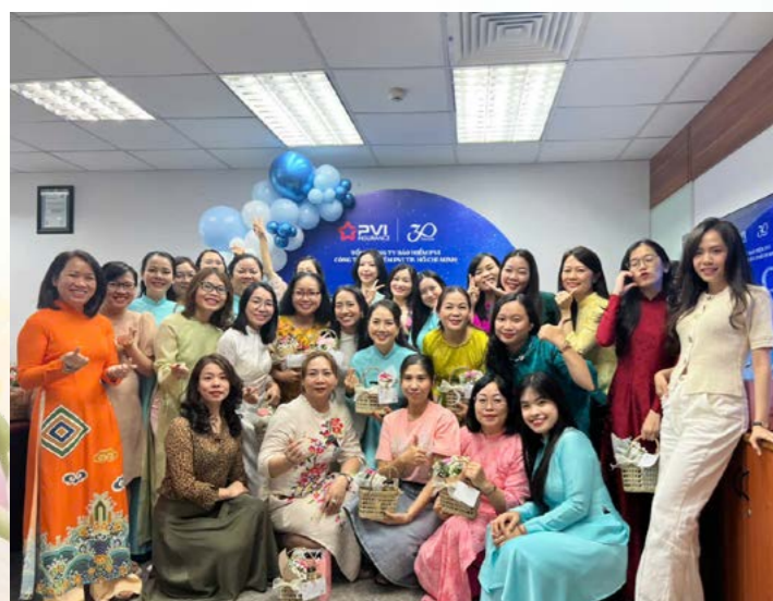
PVI Hồ Chí Minh chúc mừng Ngày Quốc tế Phụ nữ 8/3