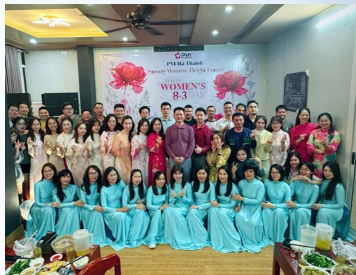
PVI Hà Thành chúc mừng Ngày Quốc tế Phụ nữ 8/3