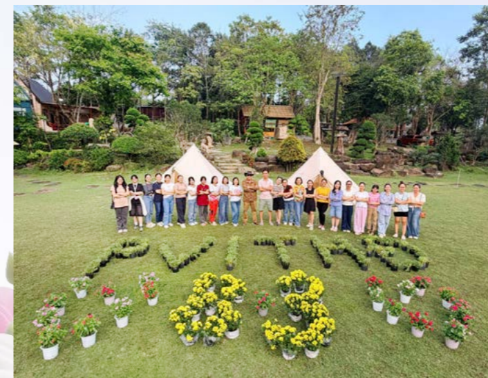
PVI Thành Đô chúc mừng Ngày Quốc tế Phụ nữ 8/3