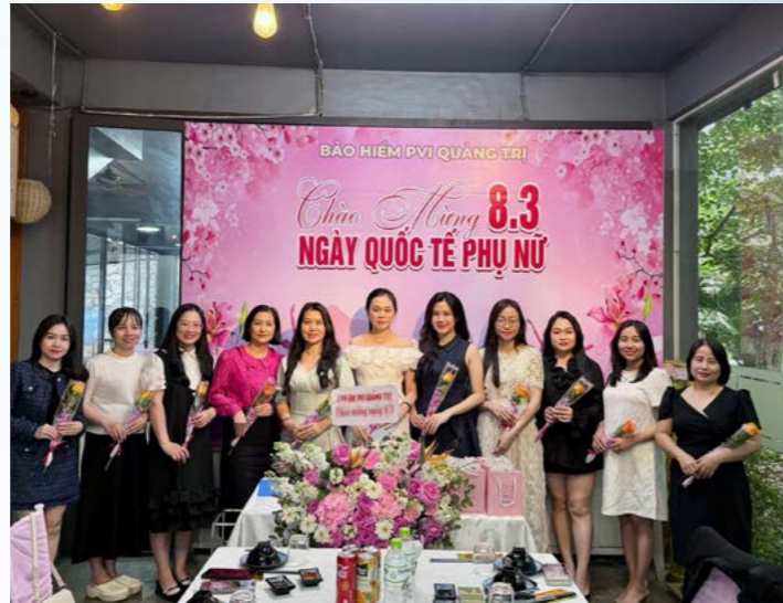
PVI Quảng Trị chúc mừng Ngày Quốc tế Phụ nữ 8/3