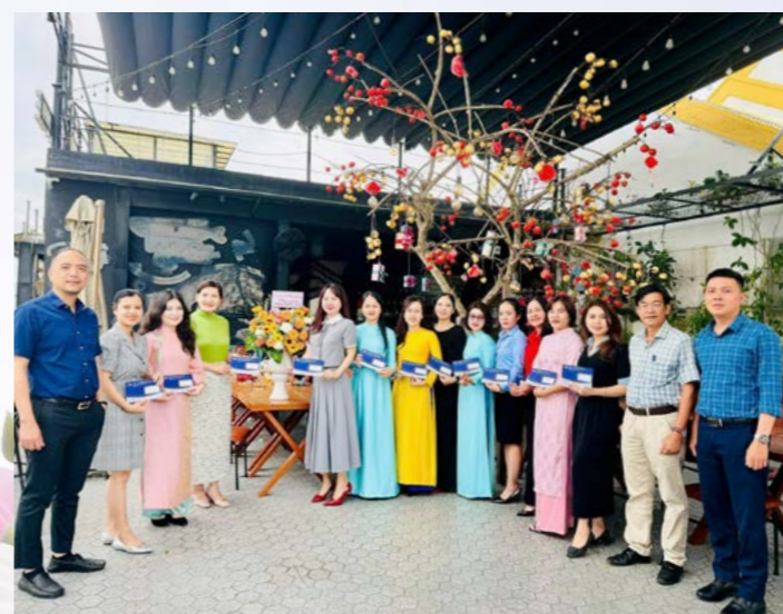
PVI Nam Đà Nẵng chúc mừng Ngày Quốc tế Phụ nữ 8/3