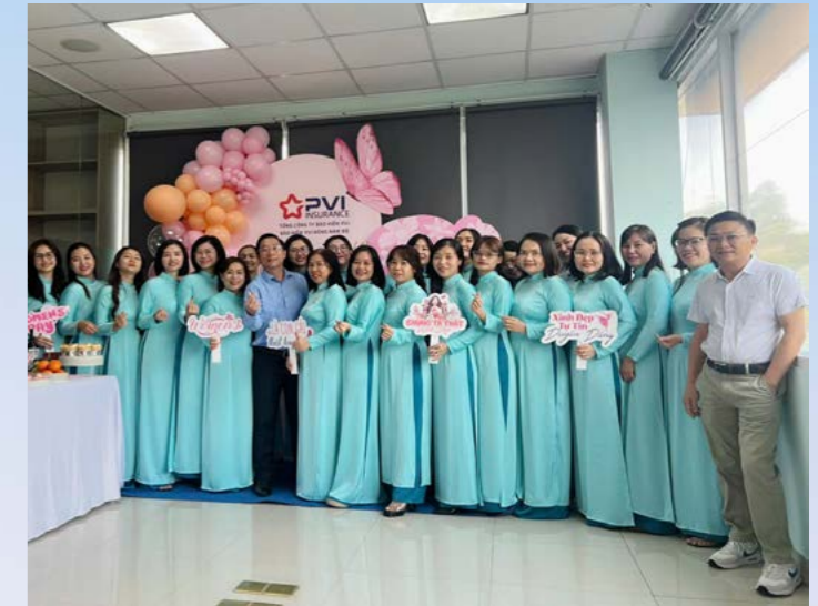
PVI Đông Nam Bộ chúc mừng Ngày Quốc tế Phụ nữ 8/3