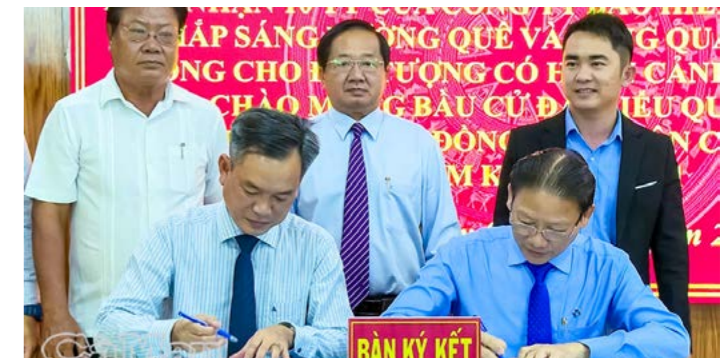
Ủy ban MTTQ Việt Nam tỉnh Cà Mau và Công ty Bảo hiểm PVI Tây Nam ký kết chương trình hợp tác giai đoạn 2026-2030.