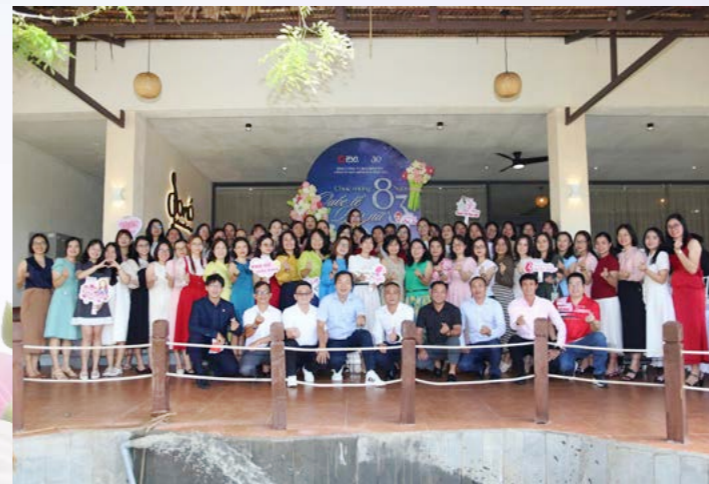
PVI Vũng Tàu chúc mừng Ngày Quốc tế Phụ nữ 8/3