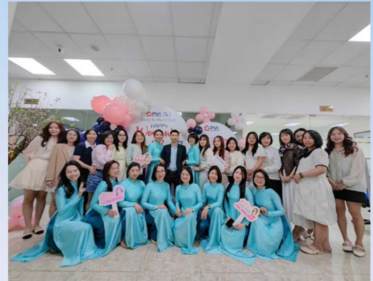
PVI Hà Nội chúc mừng Ngày Quốc tế Phụ nữ 8/3