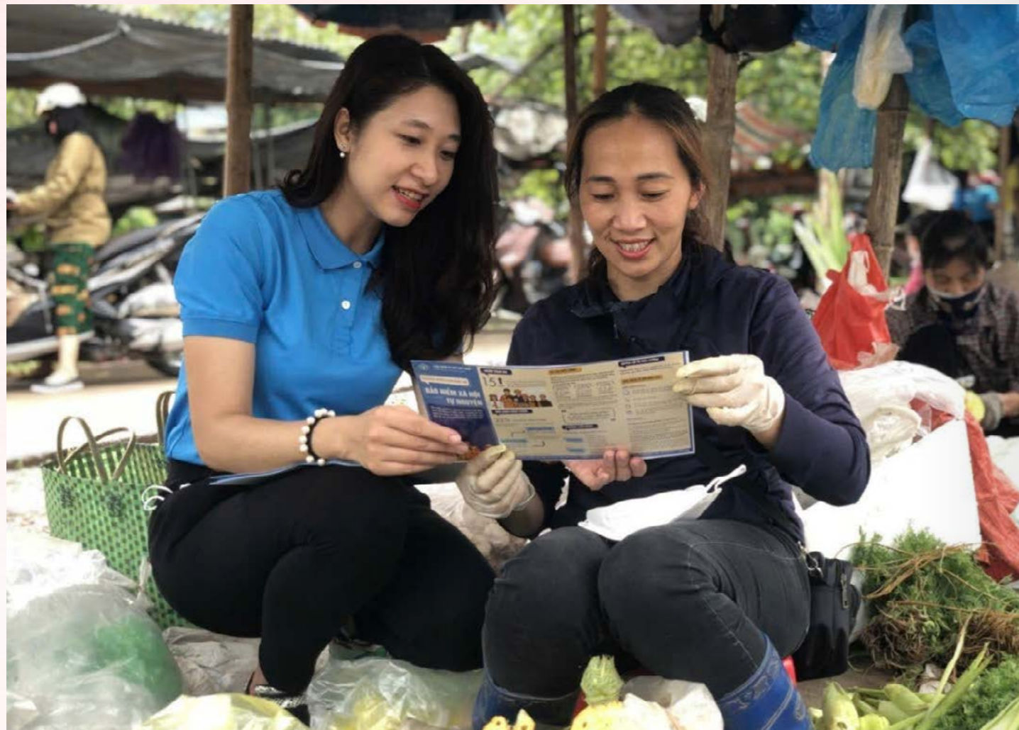
Thông tin về chính sách bảo hiểm xã hội đến người lao động.