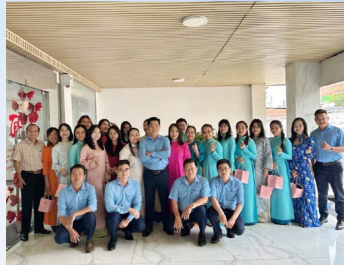
PVI Gia Định chúc mừng Ngày Quốc tế Phụ nữ 8/3