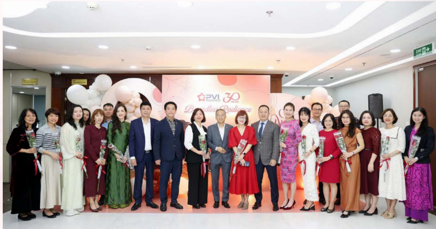
Tổng Công ty Bảo hiểm PVI chúc mừng Ngày Quốc tế Phụ nữ 8/3

Nhân dịp Ngày Quốc tế Phụ nữ 8/3, toàn hệ thống PVI trân trọng gửi những lời chúc tốt đẹp nhất tới toàn thể nữ cán bộ nhân viên đang công tác tại PVI.