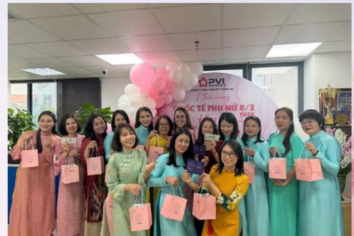
PVI Trà An chúc mừng Ngày Quốc tế Phụ nữ 8/3