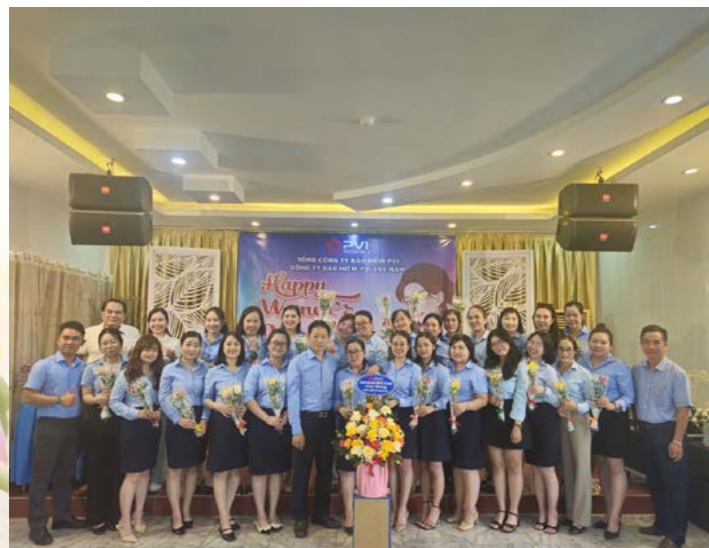
PVI Tây Nam chúc mừng Ngày Quốc tế Phụ nữ 8/3