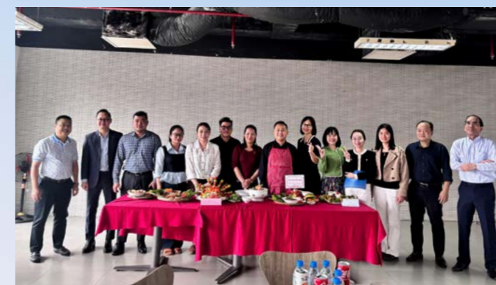
PVI Hà Nội chúc mừng Ngày Quốc tế Phụ nữ 8/3