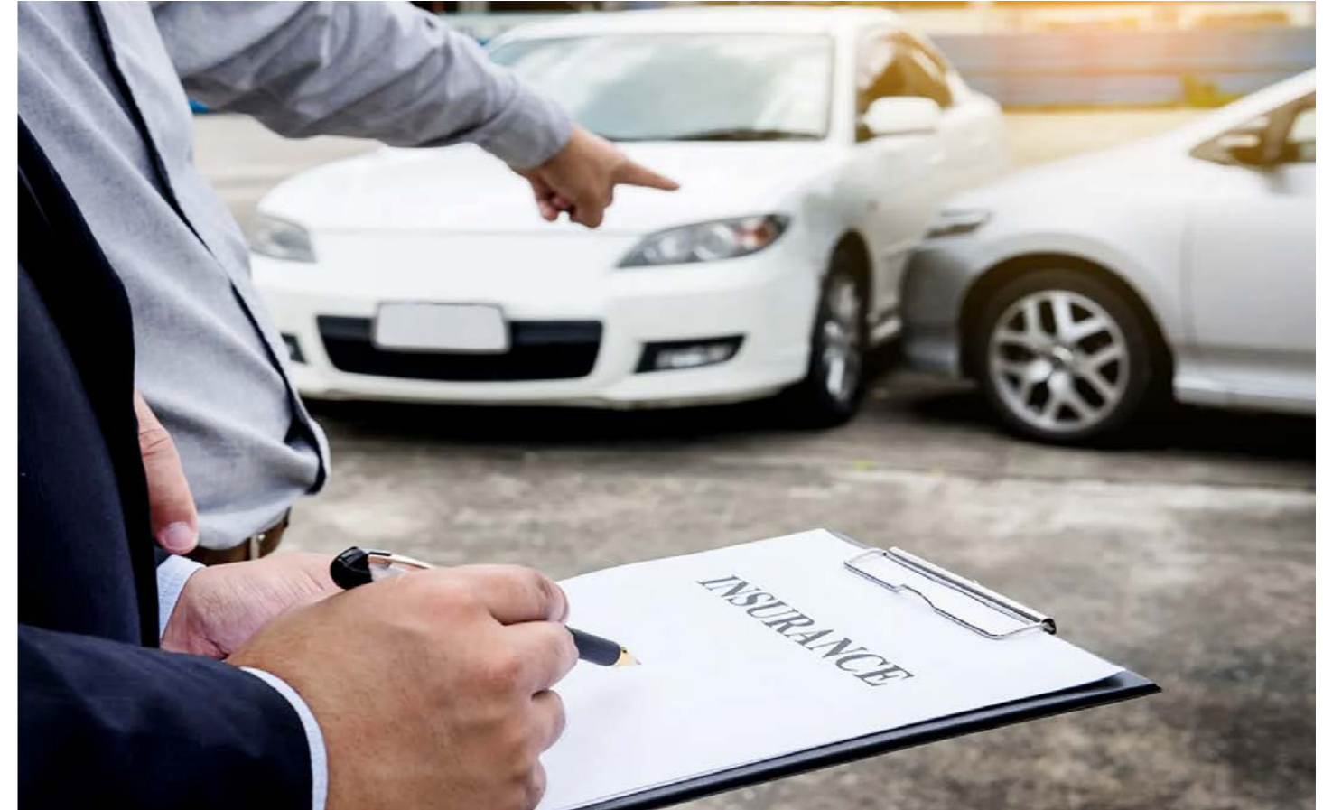
Không ít người tham gia bảo hiểm đến khi tai nạn xảy ra mới cố gắng tìm hiểu quyền lợi. Nguồn: Internet

Vì thế, tuyên truyền không chỉ để người dân biết quy định, mà để họ hiểu rằng tấm thẻ bảo hiểm bắt buộc trách nhiệm dân sự của chủ xe cơ giới không còn là giấy tờ mua cho đủ, mà là điểm tựa tinh thần nếu rủi ro xảy ra. Khi ấy, công tác tuyên truyền về ý nghĩa của bảo hiểm mới thực sự đạt hiệu quả.