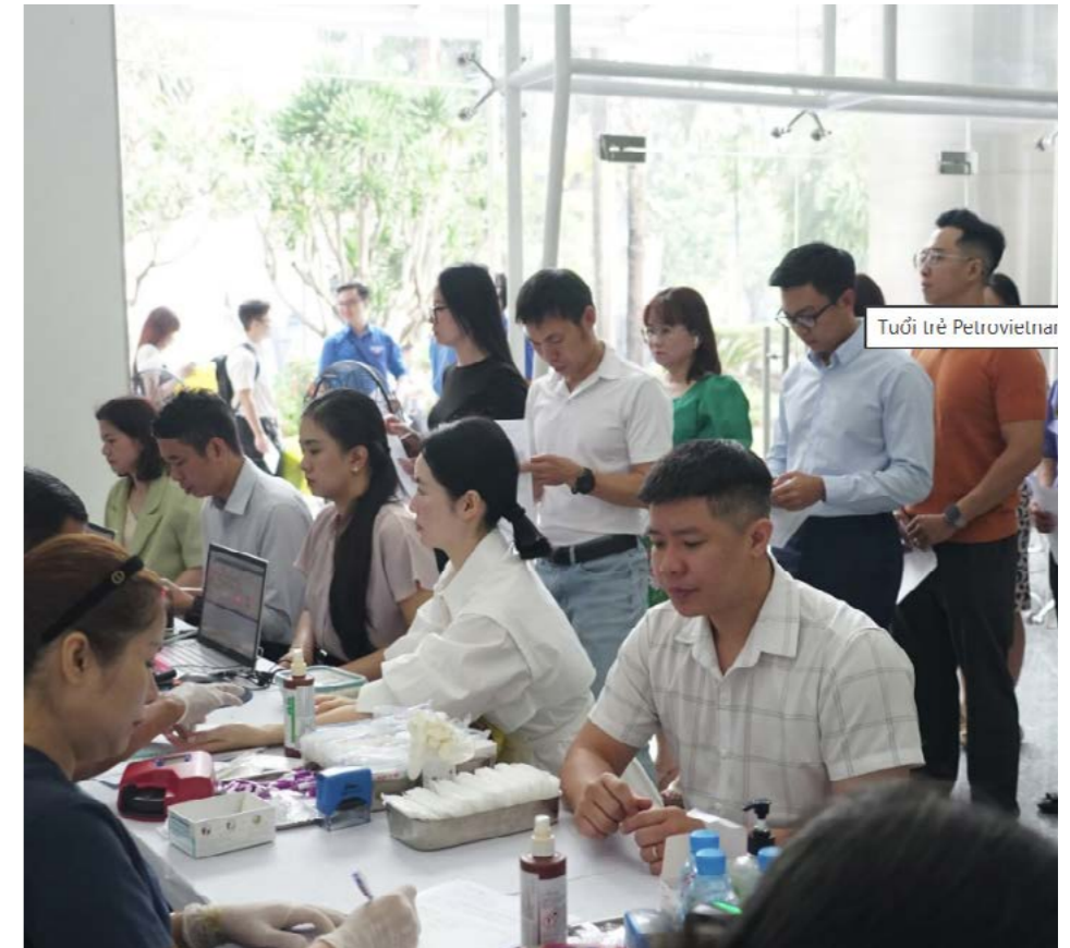
Chương trình thu hút sự tham gia đông đảo của lãnh đạo và cán bộ, nhân viên nhiều đơn vị thành viên của Petrovietnam đang hoạt động tại TP Hồ Chí Minh.

“Nhiệt huyết Petrovietnam” là chương trình hiến máu tình nguyện được Đoàn Thanh niên các đơn vị Petrovietnam khu vực TP.HCM tổ chức thường niên nhằm phát huy tinh thần xung kích, trách nhiệm xã hội của cán bộ, người lao động trong ngành dầu khí. Năm 2026 đánh dấu lần thứ 10 chương trình được tổ chức, thu hút hơn 300 người tham gia và tiếp nhận 317 đơn vị máu, tăng 14 đơn vị so với năm 2025. Qua một thập kỷ duy trì, chương trình không chỉ đóng góp nguồn máu quý giá cho công tác cấp cứu và điều trị mà còn trở thành hoạt động thiện nguyện giàu ý nghĩa, góp phần lan tỏa tinh thần đoàn kết và sẻ chia trong cộng đồng.