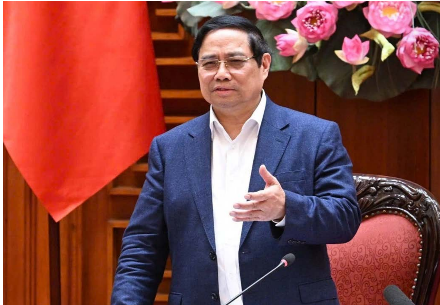
Thủ tướng Phạm Minh Chính chủ trì cuộc họp với Tổ công tác bảo đảm an ninh năng lượng chiều 10/3.

Trước diễn biến phức tạp của xung đột quân sự tại Trung Đông, Thủ tướng Phạm Minh Chính yêu cầu các bộ, ngành và tập đoàn năng lượng chủ động các kịch bản ứng phó. Trong đó, Petrovietnam được giao nhiệm vụ đẩy mạnh tối đa khai thác dầu khí, phối hợp đa dạng hóa nguồn cung dầu thô, góp phần bảo đảm an ninh năng lượng.