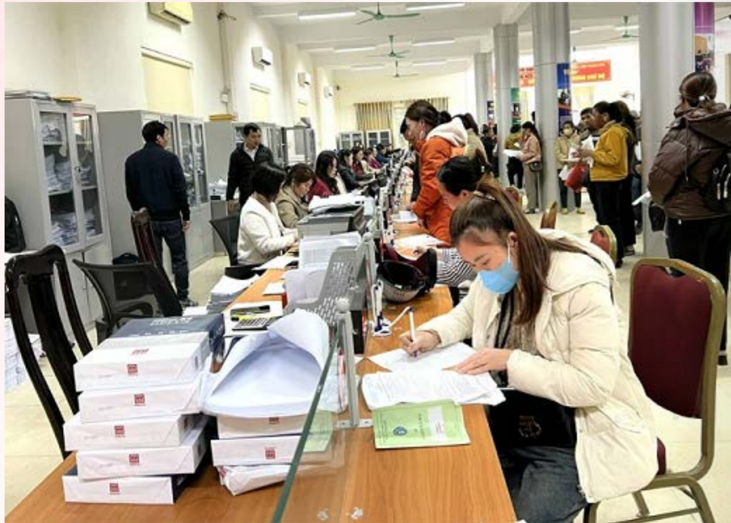
Lao động đến tìm hiểu về chính sách bảo hiểm thất nghiệp tại Trung tâm Dịch vụ việc làm Thanh Hóa.

Trong bối cảnh thị trường lao động Việt Nam đang chuyển dịch mạnh mẽ, khu vực lao động phi chính thức ngày càng chiếm tỷ trọng lớn và đóng góp quan trọng cho nền kinh tế. Tuy nhiên, đây cũng là nhóm đối tượng dễ bị tổn thương trước những biến động về việc làm, thu nhập và sức khỏe. Nhận thức rõ thực tế này, thời gian qua, hệ thống BHXH Việt Nam đã triển khai nhiều giải pháp nhằm mở rộng diện bao phủ BHXH, đặc biệt là BHXH tự nguyện, từng bước đưa chính sách an sinh xã hội đến gần hơn với người lao động tự do, góp phần hướng tới mục tiêu BHXH toàn dân.