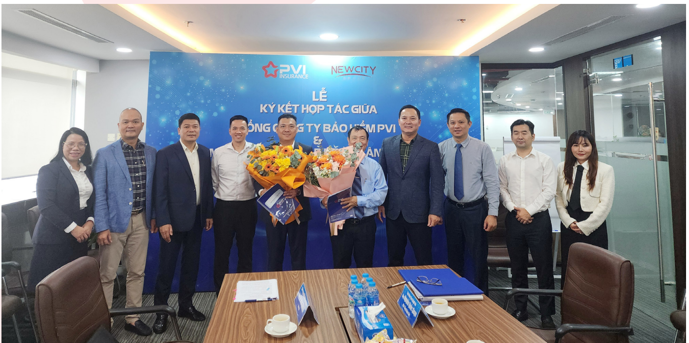
Đại diện hai bên chụp hình lưu niệm chúc mừng thành công của buổi lễ

Phát biểu tại buổi lễ, lãnh đạo hai bên đều bày tỏ kỳ vọng việc hợp tác sẽ tạo ra mối quan hệ chặt chẽ, bền vững và lâu dài nhằm phát triển trên nguyên tắc tôn trọng các lợi ích cũng như uy tín và thương hiệu của các bên.