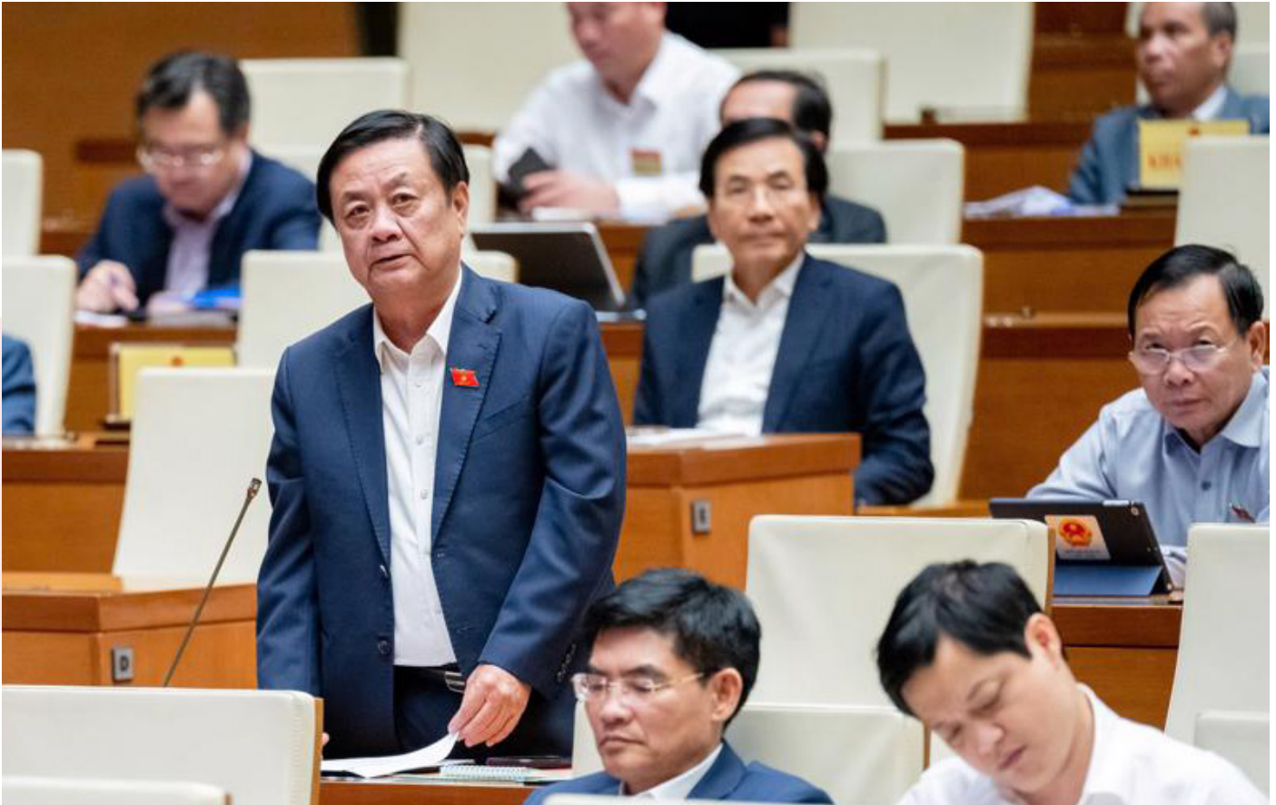
Bộ trưởng Bộ Nông nghiệp và Phát triển nông thôn Lê Minh Hoan giải trình, làm rõ một số vấn đề đại biểu Quốc hội nêu chiều ngày 4/11.

Trong phiên thảo luận tại hội trường về kết quả thực hiện kế hoạch phát triển kinh tế- xã hội năm 2024; dự kiến kế hoạch năm 2025 ngày 4/11, vấn đề hỗ trợ sản xuất nông nghiệp tổn thất sau bão lũ, bài học từ cơn bão Yagi vừa qua cũng như việc tập trung khai thác phát triển một trong những nguồn lực nội sinh của đất nước (nông nghiệp) được đại biểu quan tâm cho ý kiến.