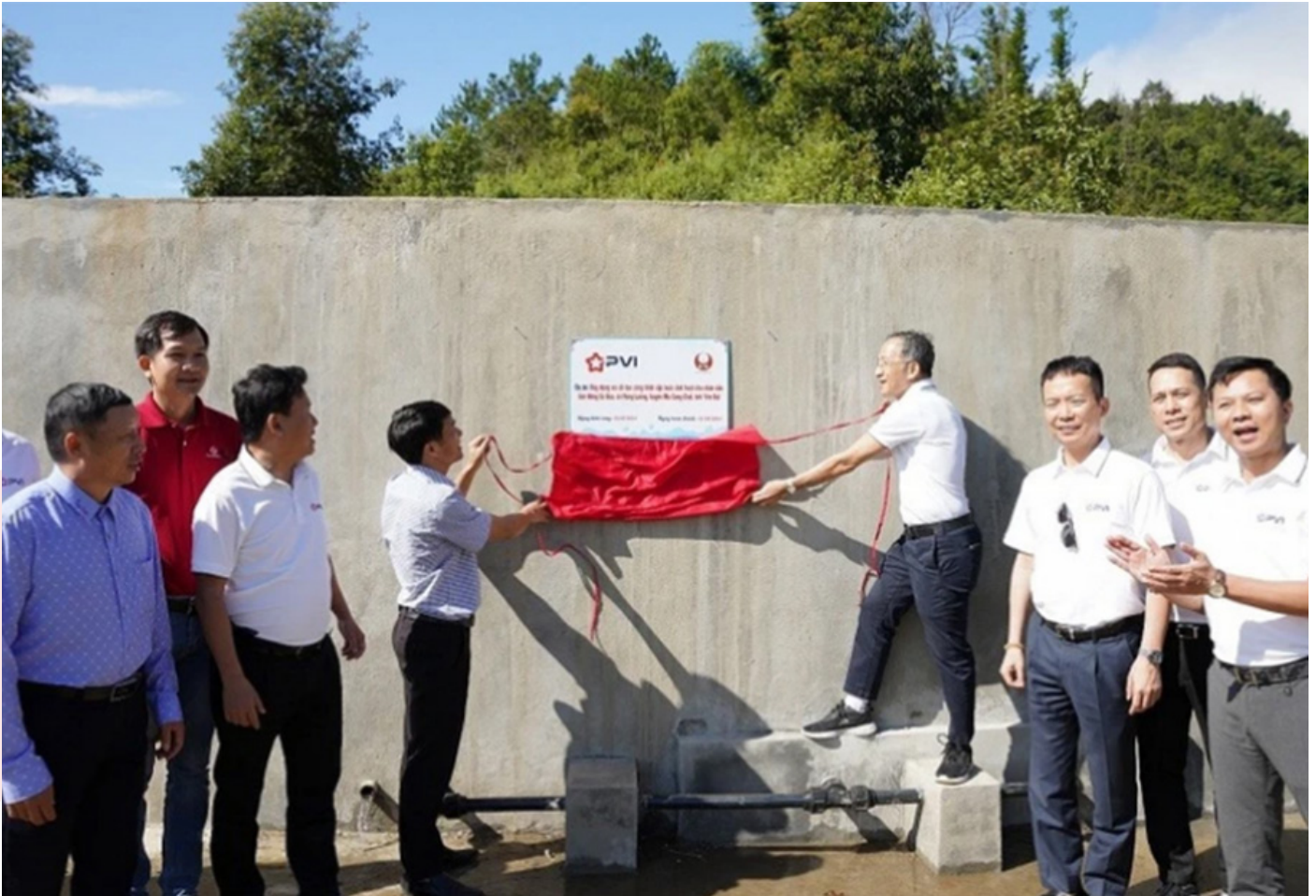
PVI tháo băng khánh thành công trình cấp nước sinh hoạt tại bản Háng Cơ Bua, xã Púng Luông, huyện Mù Cang Chải, tỉnh Yên Bái.

Những ngày đầu tháng 10/2024, người dân bản Háng Cơ Bua, huyện vùng cao Mù Cang Chải (Yên Bái) phấn khởi đón tin vui khi công trình cấp nước sinh hoạt mới chính thức được khánh thành và đưa vào sử dụng, góp phần giải quyết tình trạng thiếu nước sạch của 72 hộ gia đình với hơn 350 nhân khẩu nơi đây.