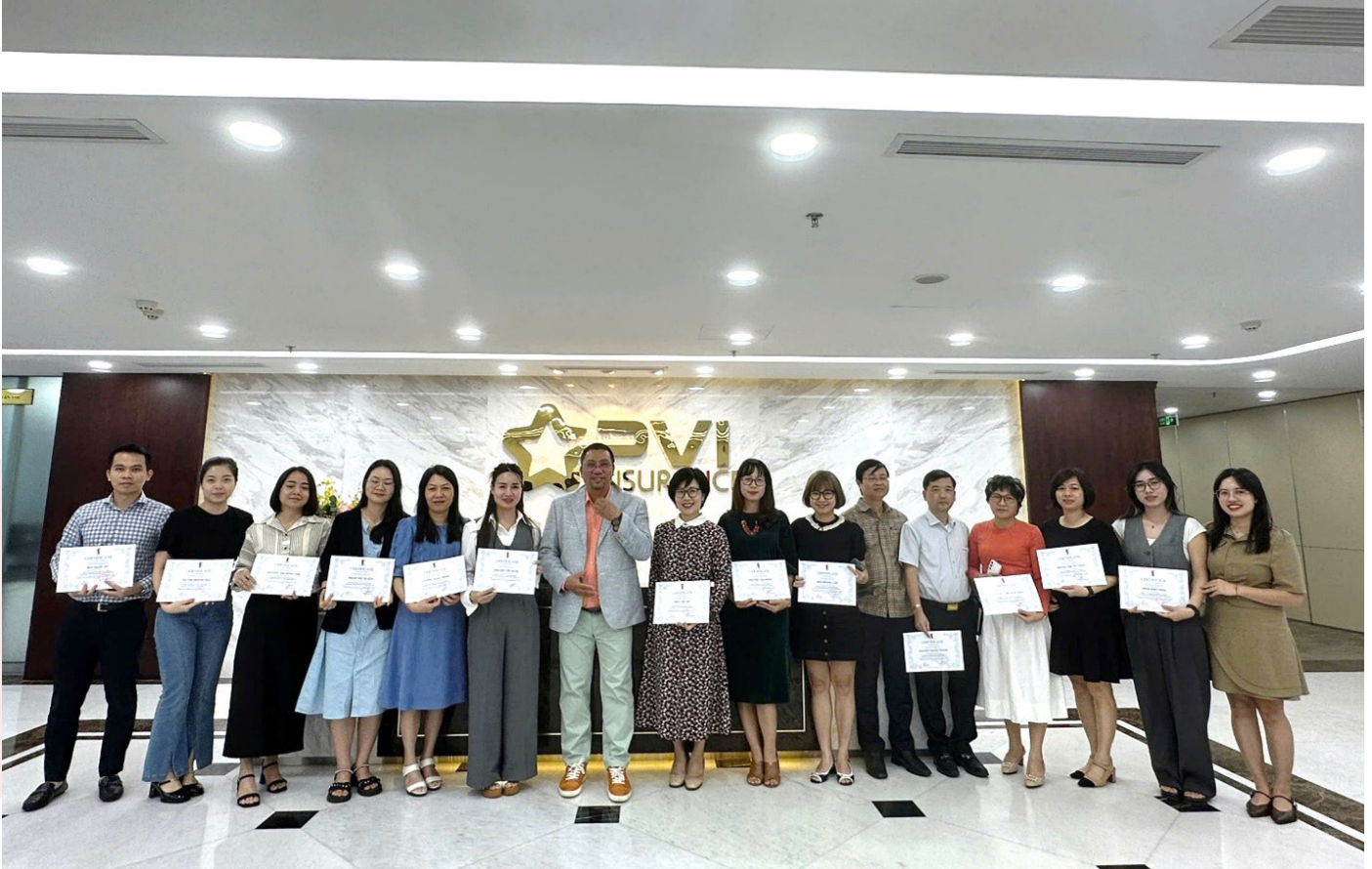
Các học viên tham dự nhận chứng chỉ hoàn thành lớp học

Sau buổi học, các học viên đã được trang bị những kiến thức, kỹ năng cũng như cách vận dụng linh hoạt các kiến thức đó với mô hình và hoạt động thực tế tại PVI và từng đơn vị. Thông qua các khóa đào tạo ngắn hạn về truyền thông, PVI Holdings đã góp phần mang lại giá trị gia tăng cho toàn hệ thống đồng thời tạo sự gắn kết trong nội bộ ngành dọc Truyền thông và Văn hóa doanh nghiệp của PVI.