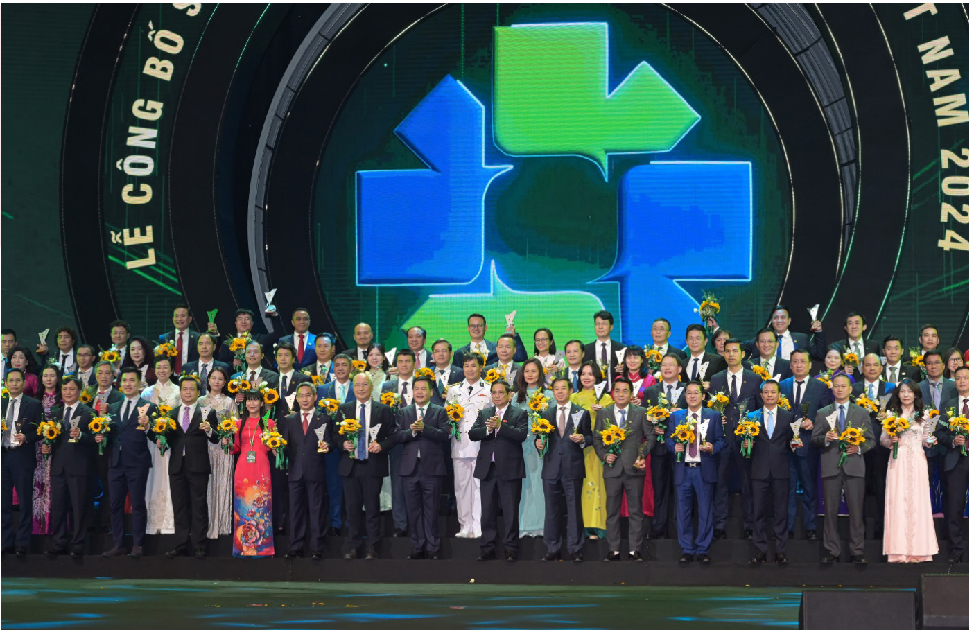
Thủ tướng Phạm Minh Chính và Bộ trưởng Bộ Công Thương Nguyễn Hồng Diên chúc mừng các doanh nghiệp đạt Thương hiệu quốc gia năm 2024

Cùng dự buổi lễ có Phó Thủ tướng Chính phủ, Bộ trưởng Bộ Ngoại giao Bùi Thanh Sơn; Bộ trưởng Bộ Công Thương Nguyễn Hồng Diên; Bộ trưởng Bộ Nông nghiệp và Phát triển nông thôn Lê Minh Hoan; cùng đại diện lãnh đạo các bộ, ban, ngành Trung ương, lãnh đạo các địa phương và đại diện 190 doanh nghiệp có sản phẩm đạt Thương hiệu quốc gia Việt Nam năm 2024.