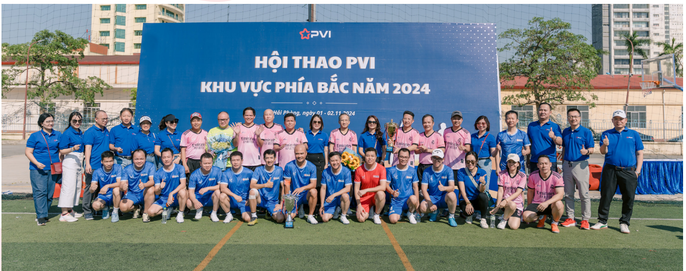
Tập thể lãnh đạo chụp hình lưu niệm