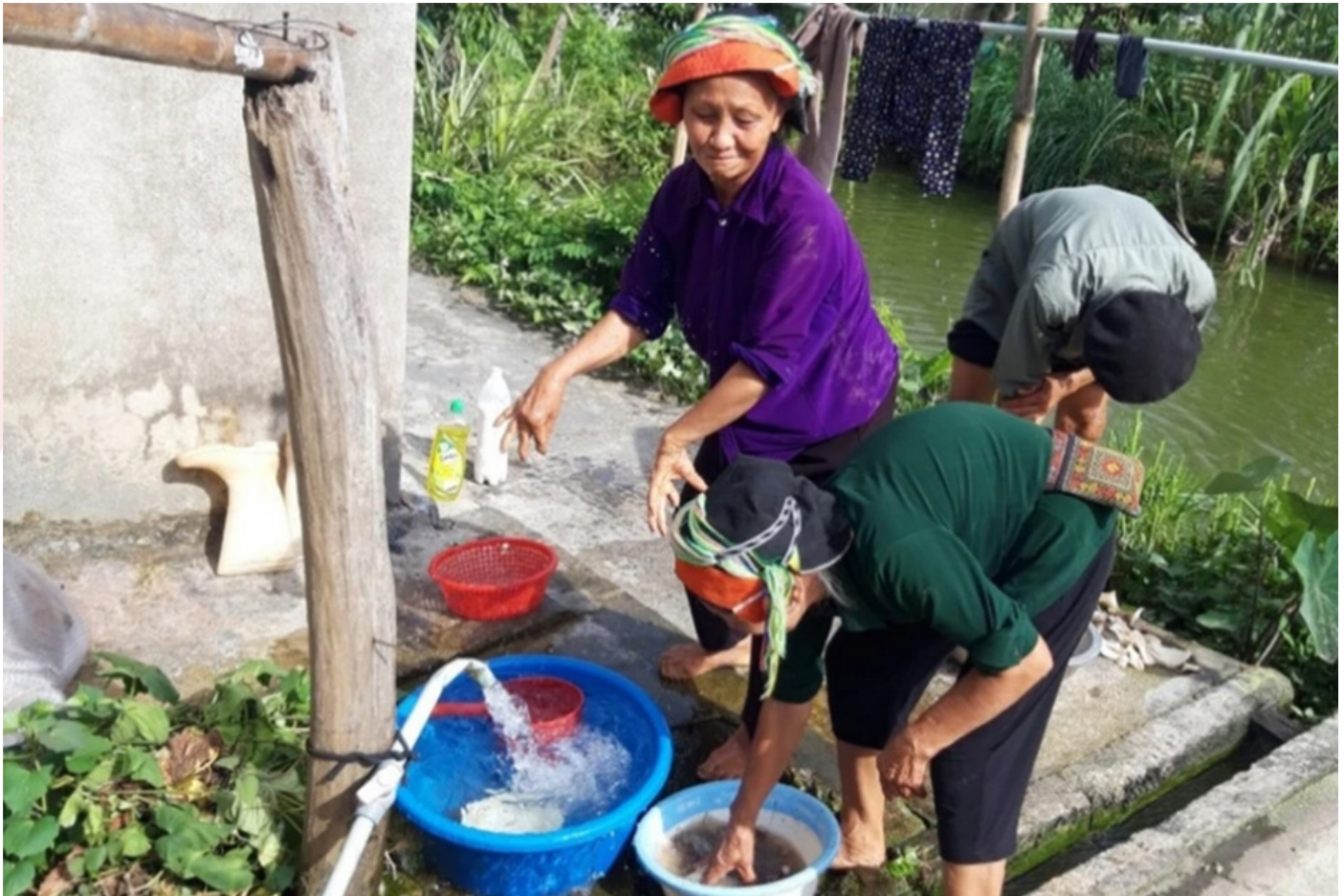
Người dân bản Háng Cơ Bua phấn khởi khi từ nay không còn phải di chuyển quãng đường xa để lấy nước sinh hoạt nữa.

Tại bản Háng Cơ Bua, dự án bầu ra 1 nhóm người dân nòng cốt từ 7-10 người (là những người có uy tín, trách nhiệm trong bản, bao gồm cả phụ nữ). Những thành viên nòng cốt này được dự án hướng dẫn/tập huấn các kiến thức, kỹ năng để biết cách lập kế hoạch, quản lý tài chính, kỹ thuật xây dựng, cũng như huy động sự tham gia của người dân trong các hoạt động xây dựng, duy tu bảo dưỡng công trình của dự án và các công trình khác tại địa phương.