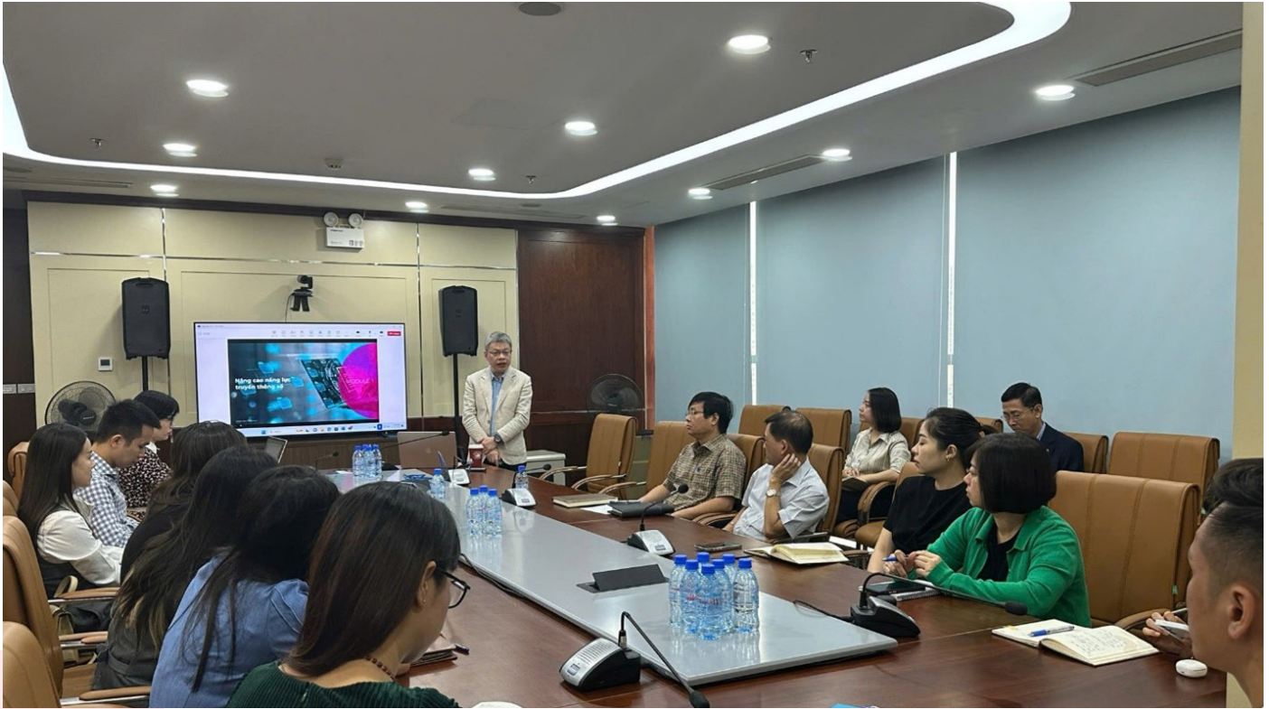
Toàn cảnh lớp học

Tham dự khóa học có sự hiện diện của toàn bộ CBNV phụ trách truyền thông và văn hóa doanh nghiệp tại PVI Holdings và các công ty con, bao gồm 23 thành viên tham dự trực tiếp và 03 thành viên tham dự online.