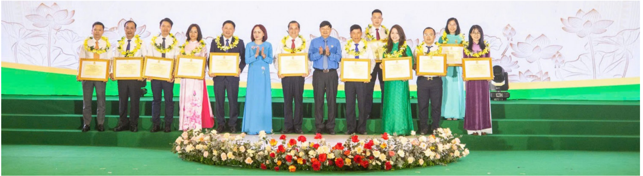
Tuyên dương, khen thưởng các cá nhân tiêu biểu trong học tập và làm theo tư tưởng, đạo đức, phong cách Hồ Chí Minh.