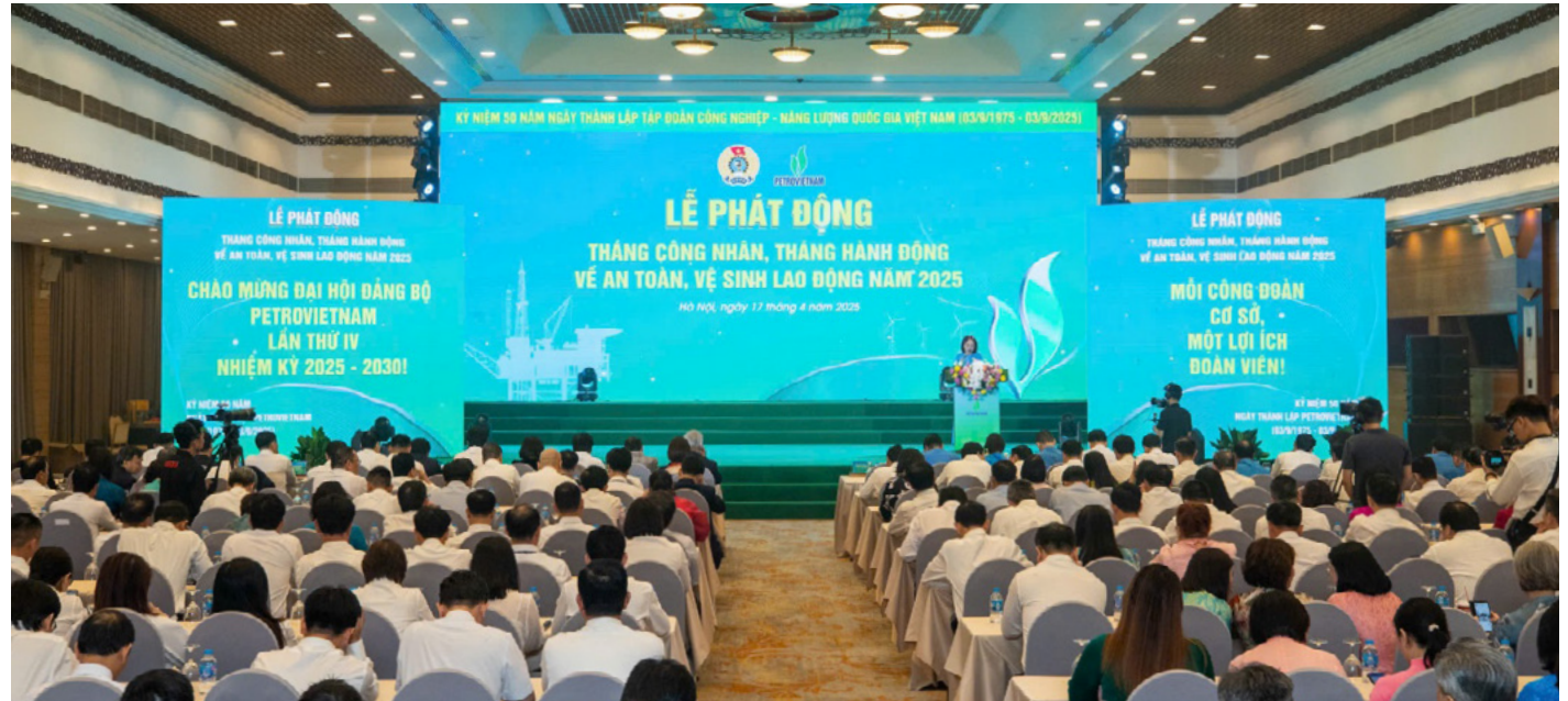
Toàn cảnh Lễ phát động.

Lễ phát động Tháng Công nhân, Tháng hành động về ATVSLĐ năm 2025 được Công đoàn Dầu khí Việt Nam (CĐ DKVN) tổ chức vào ngày 17/4. Sự kiện diễn ra trong thời điểm đặc biệt ý nghĩa nhân kỷ niệm 50 năm thành lập Petrovietnam (1975-2025). Đây là mốc son quan trọng đánh dấu quá trình trưởng thành và phát triển của Tập đoàn, đồng thời cũng là mốc son của sự phát triển theo mô hình Tập đoàn Công nghiệp - Năng lượng Quốc gia Việt Nam, với sứ mệnh trở thành trung tâm công nghiệp, dịch vụ, năng lượng, trụ cột đảm bảo an ninh năng lượng quốc gia và tiên phong trong chuyển đổi xanh, chuyển đổi số.