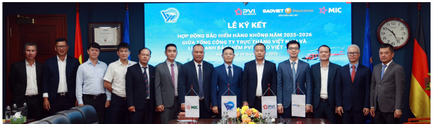
Đại diện các Bên chụp ảnh lưu niệm