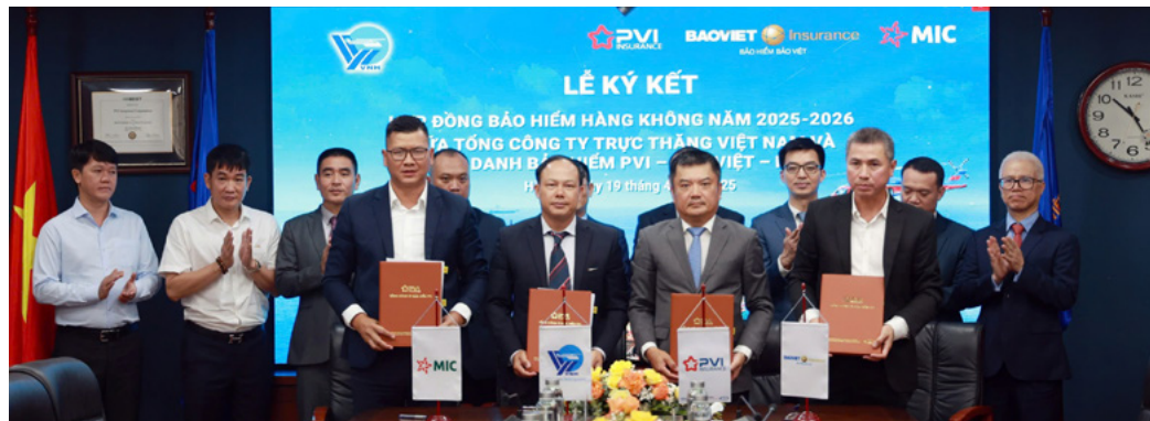
Đại diện các Bên thực hiện ký kết