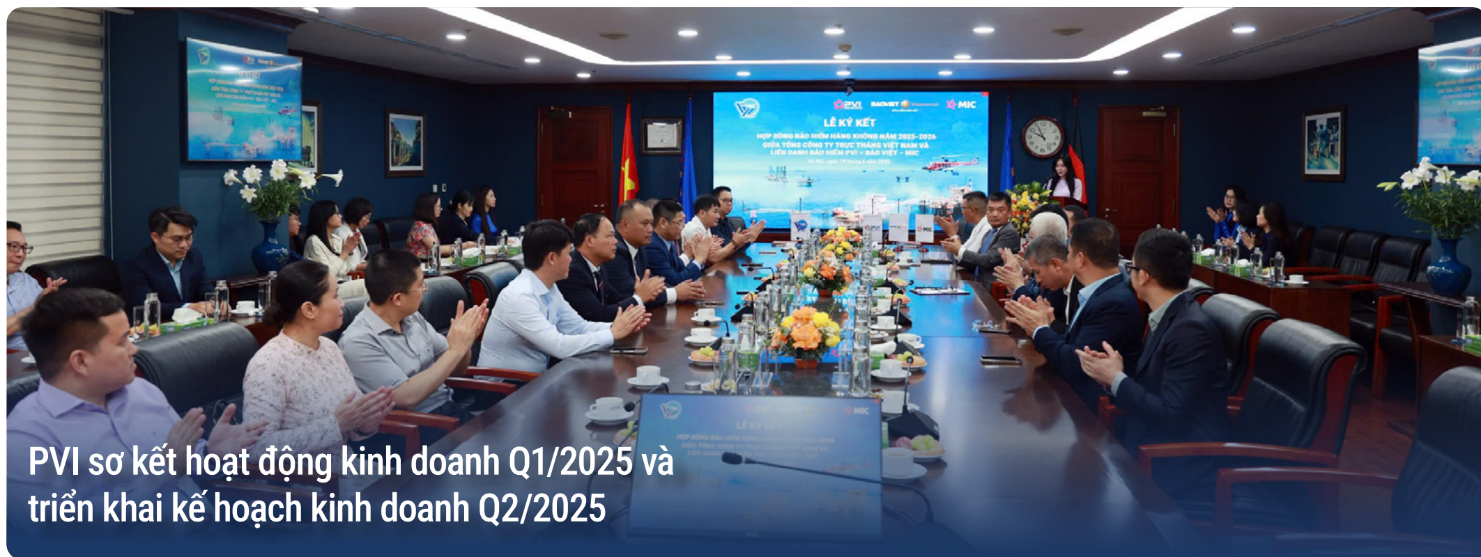
PVI sơ kết hoạt động kinh doanh Q1/2025 và triển khai kế hoạch kinh doanh Q2/2025

Khẳng định niềm tin - Gắn kết chiến lược vì an toàn bay cùng Tổng công ty Trục thăng Việt Nam