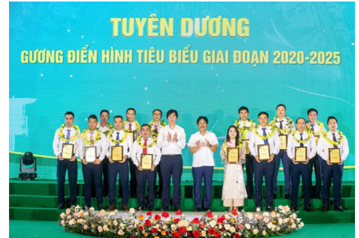
Tuyên dương gương điển hình tiêu biểu giai đoạn 2020-2025.