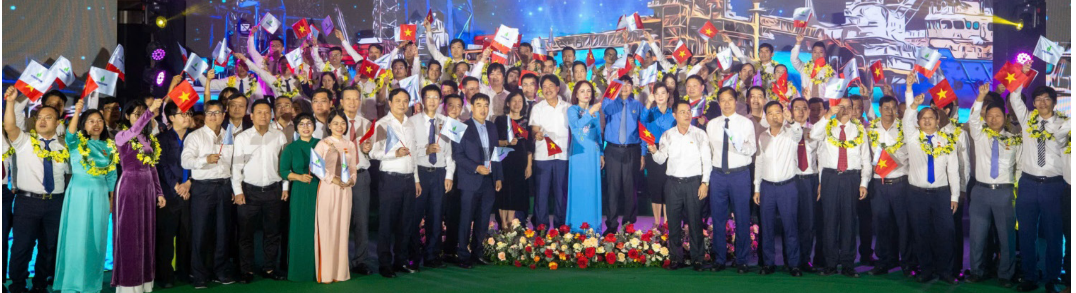
Các đại biểu tham dự chương trình