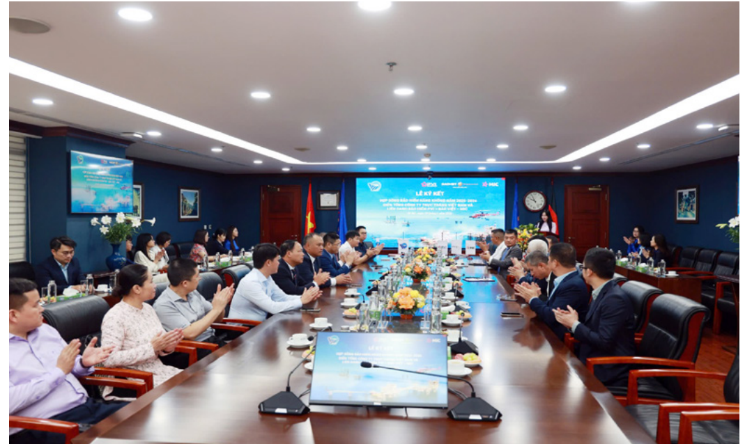
Toàn cảnh buổi lễ

tuyệt đối tại VNH. Chúng tôi định hướng phát triển theo hướng hiện đại, bền vững, đáp ứng nhu cầu bay ngày càng cao trong và ngoài nước. Việc hiện đại hóa đội bay sẽ tiếp tục được đẩy mạnh. Chúng tôi đánh giá cao vai trò đồng hành của Liên danh bảo hiểm trong hành trình này.”