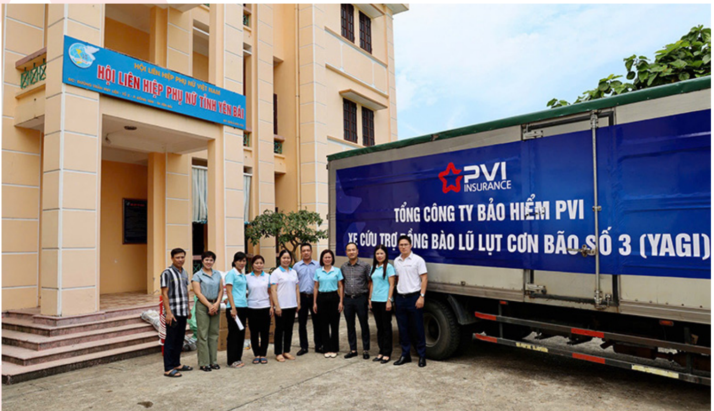
Đại diện một doanh nghiệp bảo hiểm trao quà, chia sẻ khó khăn cùng người dân bị ảnh hưởng bão số 3 (Yagi).

Các loại hình bảo hiểm phi nhân thọ như bảo hiểm tài sản, bảo hiểm trách nhiệm, bảo hiểm sức khỏe, và bảo hiểm hàng hóa vận chuyển... đóng vai trò thiết yếu trong việc hỗ trợ doanh nghiệp và cá nhân vượt qua khó khăn khi xảy ra sự cố. Khi người dân và doanh nghiệp được bảo vệ trước rủi ro bất ngờ – như thiên tai, tai nạn hay gián đoạn chuỗi cung ứng – năng lực phục hồi kinh tế sẽ được cải thiện rõ rệt. Đồng thời, nhờ cơ chế bảo hiểm, những tổn thất kinh tế không chỉ được phân tán mà còn “chuyển giao” một cách có kiểm soát, giúp giảm áp lực tài chính cho ngân sách nhà nước, cho ngân hàng và cho toàn xã hội.