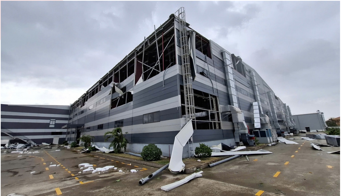
Doanh nghiệp bảo hiểm tạm ứng bồi thường khắc phục thiệt hại bão số 3.

Ngoài ra, bảo hiểm cũng đóng vai trò quan trọng trong việc hỗ trợ doanh nghiệp đổi mới và sáng tạo. Trong quá trình phát triển, các doanh nghiệp luôn phải đối mặt với nhiều rủi ro khi đầu tư vào các sản phẩm và dịch vụ mới. Nhờ có bảo hiểm, họ có thể yên tâm hơn khi thử nghiệm những công nghệ tiên tiến, sáng tạo và đưa ra các sản phẩm, dịch vụ mới mà không lo ngại về những tổn thất quá lớn nếu có sự cố xảy ra. Chính yếu tố này là động lực để thúc đẩy sự sáng tạo và nâng cao năng lực cạnh tranh của các doanh nghiệp, từ đó đóng góp vào tăng trưởng kinh tế.