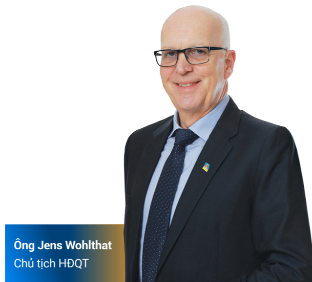
Ông Jens Wohlthat Chủ tịch HĐQT

về hiệu quả nghiệp vụ. Đặc biệt, năm 2021, bảo hiểm PVI đã viết lên khúc ca khai hoàn 10.000 tỷ doanh thu đầy tự hào, đầy ấn tượng chào mừng 25 năm PVI trong những ngày cuối cùng của năm 2021. Bên cạnh đó, tên tuổi Bảo hiểm PVI cũng được tôn vinh tại nhiều lễ trao giải danh giá: Top 50 doanh nghiệp lợi nhuận xuất sắc nhất Việt Nam; Công ty bảo hiểm phi nhân thọ tốt nhất Việt Nam 2021...Tái bảo hiểm PVI đạt mức doanh thu và lợi nhuận cao nhất trong lịch sử 10 năm thành lập đồng thời đang từng bước mở rộng hoạt động kinh doanh cũng như đẩy mạnh và quảng bá hình ảnh trên thị trường quốc tế. Công ty cổ phần Quản lý Quỹ PVI đã áp dụng đưa vào các loại hình quỹ mới nhằm nâng cao hiệu quả dòng tiền và đóng góp vào kết quả kinh doanh chung của toàn hệ thống.