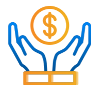
Kinh doanh bảo hiểm và tái bảo hiểm