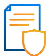
Hoạt động nắm giữ tài sản

Hoạt động kinh doanh chính của Công ty mẹ và các công ty con: