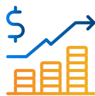
Hoạt động dịch vụ Tài chính