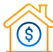
Kinh doanh bất động sản